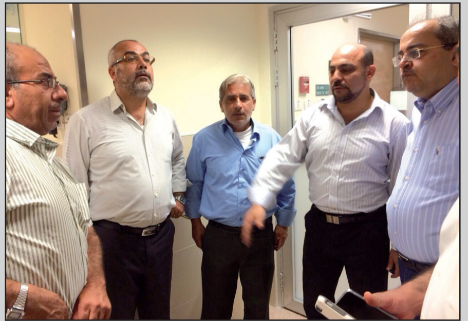
صورة التقطت خلال زيارة أعضاء الكنيست