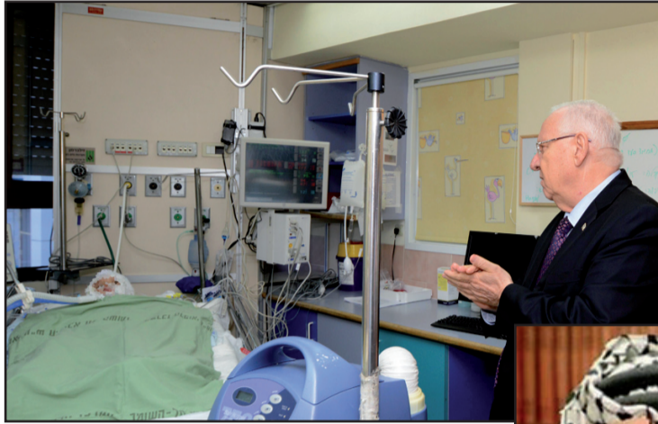
رئيس الدولة خلال زيارته للطفل المصاب

من جانبها ، قالت المتحدث باسم الشرطة لوبا السمري " أن هيئة التحقيقات والاستخبارات في شرطة اسرائيل وبناء على توجيهات من الصحفيين حول منشورات وبيانات مؤذية معادية لرئيس الدولة رؤوفين ريفلين التي تم نشرها ، مؤخرا ، على صفحات شبكات التواصل الاجتماعي ، تؤكد على أنه في أعقاب التقارير والمنشورات وتوجه من قبل عناصر الامن في مقر رئيس الدولة ، الذي تقدم بشكوى في شرطة منطقة موريا القدس ، قام رئيس هيئة التحقيقات والاستخبارات القطرية الجنرال ماني يتسحاقي بالقاء مهمة مواصلة التحقيقات في هذه المسألة على عاتق وحدة مكافحة جرائم الانترنت " السابير " القطرية في لاهف - 433 ، مع التأكيد على مراجعة كافة المنشورات والبجدي القصوى اللازمة ، بحيث سيتم التحقيق فيها بالتنسيق مع الجهات المخولة وفقا للشبهات التي ستطوف ويتم التوصل اليها مع الانتهاء من كافة المراجعات ذات الصلة " .