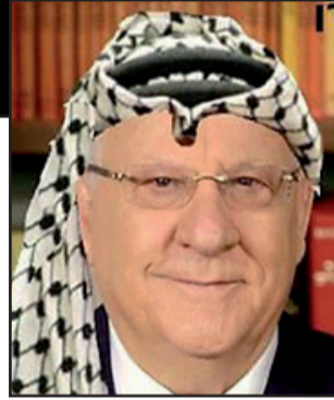
صورة مركبة لرئيس الدولة

في القدس ، الذي نظم ضد جريمة قرية دوما ، وحادثه الطعن في مسيرة القدس ، استنكر فيه بشدة جريمة قرية دوما ، قائلا : " نيران اشتعلت في بلادنا ، نيران العنف والكراهية ، نيران ايمان كاذب " . واثار خطاب ريفلين ردودا واسعة على صفحات التواصل الاجتماعي منها : " انت مخرب