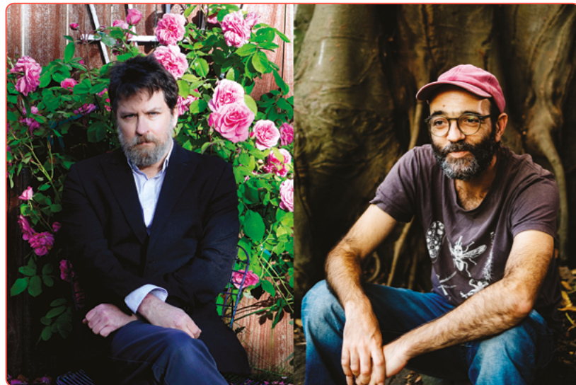
BEN CHASNY © KAMI CHASNY / NORBERTO LOBO © VERA MARMELLO