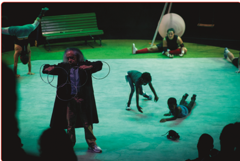
"PARQUE CENTRAL"