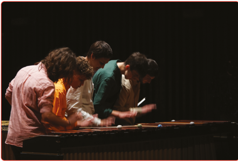
GRUPO DE PERCUSSÃO DA EMME