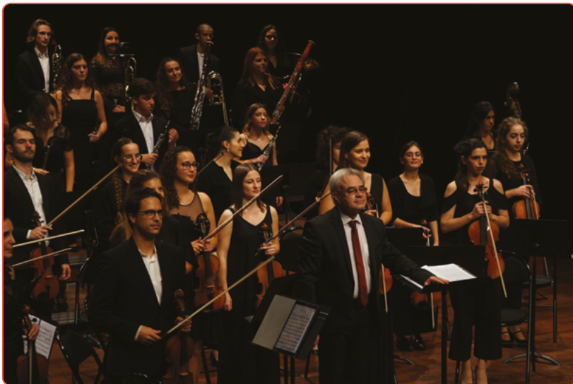
JEAN-MARC BURFIN © CAMIL A RIBEIRO MOUTINHO