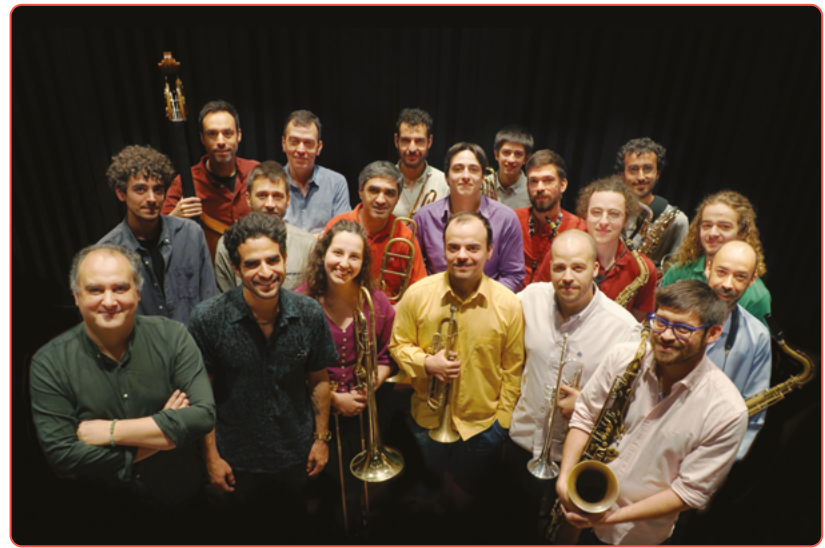
ORQUESTRA DE JAZZ DE ESPINHO