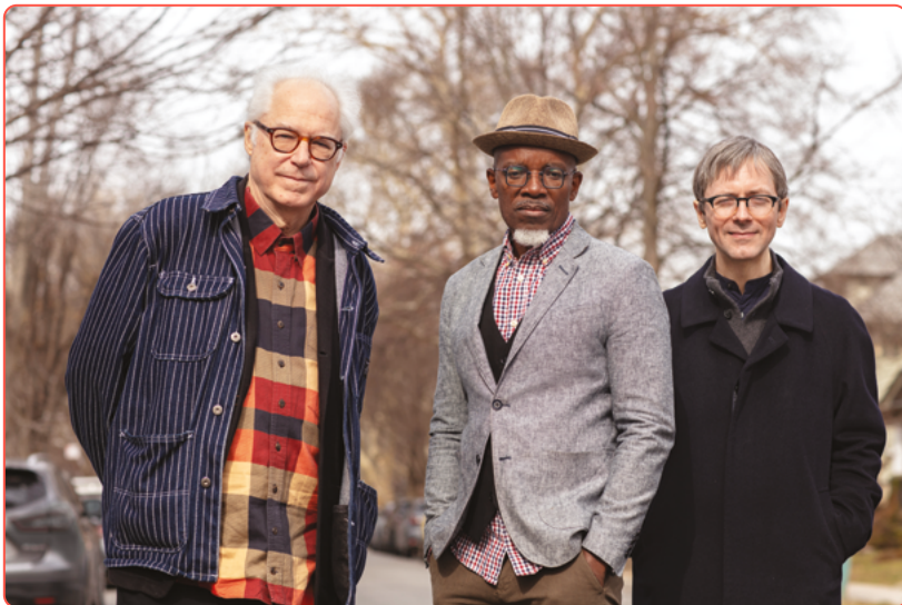
BILL FRISELL TRIO