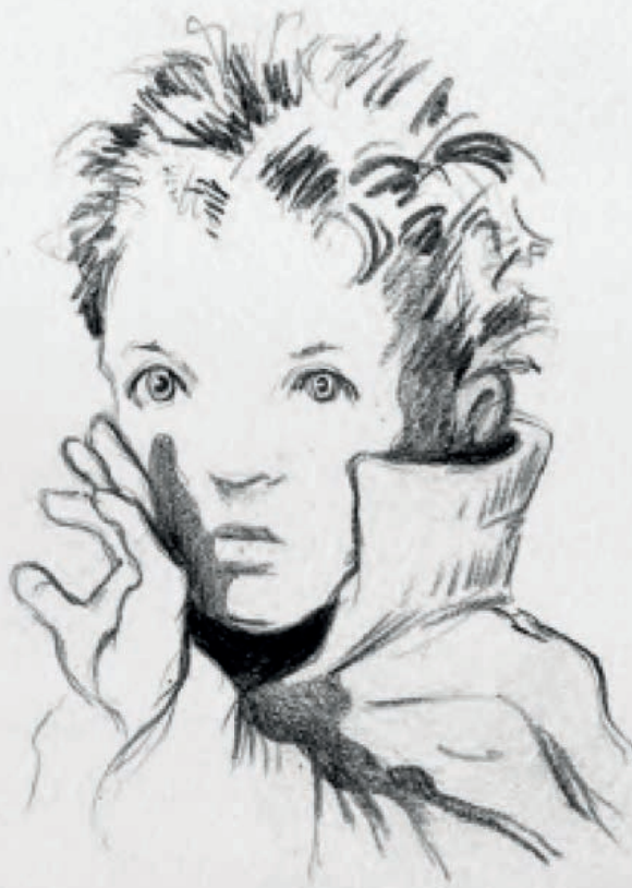
Croquis préparatoires de Michel Hazanavicius

C'est l'histoire. L'histoire imaginée par Jean-Claude Grumberg, c'est elle qui a balayé toutes mes certitudes en la matière. C'est une histoire profonde, puissante, humaniste, en même temps que délicate et modeste, et qui m'a semblé être un classique instantané quand je l'ai découverte, avant même sa publication. C'est pour moi, en tant que réalisateur, ce qu'il y a sans doute de plus difficile : trouver une histoire qui vaille le déplacement. On peut toujours trouver des bonnes scènes, des bons acteurs, des bonnes situations, des bons moments de