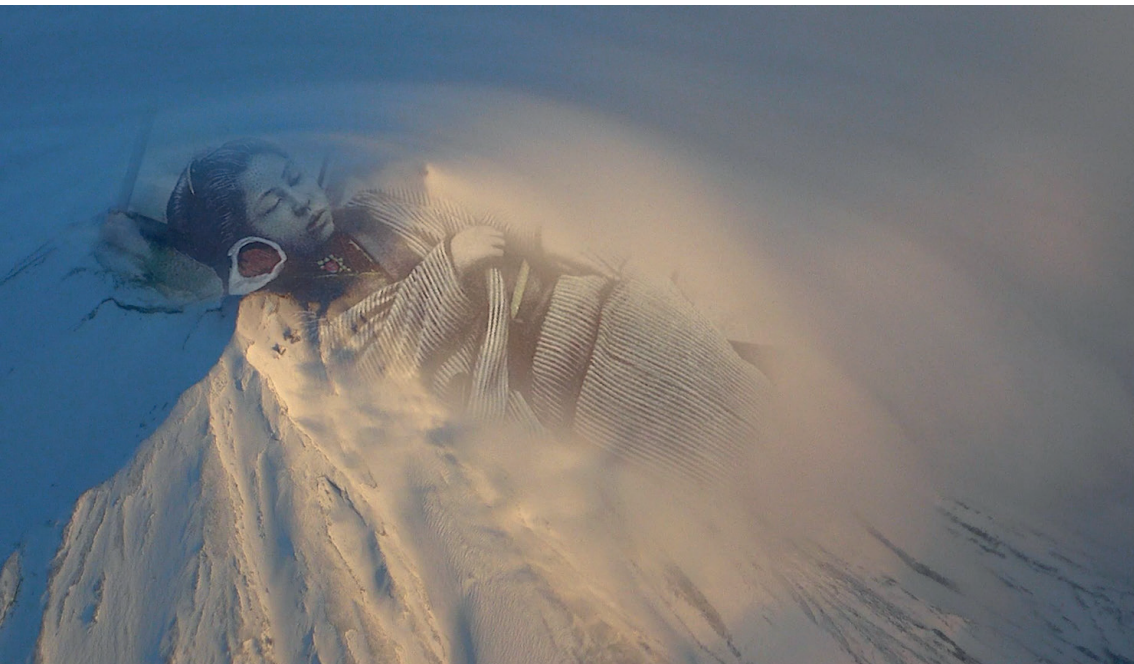
(1–9) Films Stills aus Fiona Tan, Ascent , 2016 und Installation view.

Zwiesprache ein komplexes Gespräch begleitet von der Folge der Fotos, die wir, indem wir den Film betrachten und die Tonspur hören, unsererseits miteinander in Beziehung setzen. Die Bilder scheinen dabei auf ihre Erzählungen zu reagieren und umgekehrt. Aber ist es wirklich so oder ist das nur unser Begehren, unterschiedliche Narrative aufeinander zu beziehen und aus ihnen unsere Erzählung zu machen? So oder so ergeben Bild und Ton einen Resonanzraum, der immer wieder neue Ansichten des Fuji hervorbringt und mitunter andere überblendet. An einigen Stellen des Foto-Films arbeitet Tan ganz explizit mit Doppelbelichtungen, um so verschiedene Schichten in einem Bild, einer Ansicht, die doch viele ist, erkennbar zu machen und auszustellen.