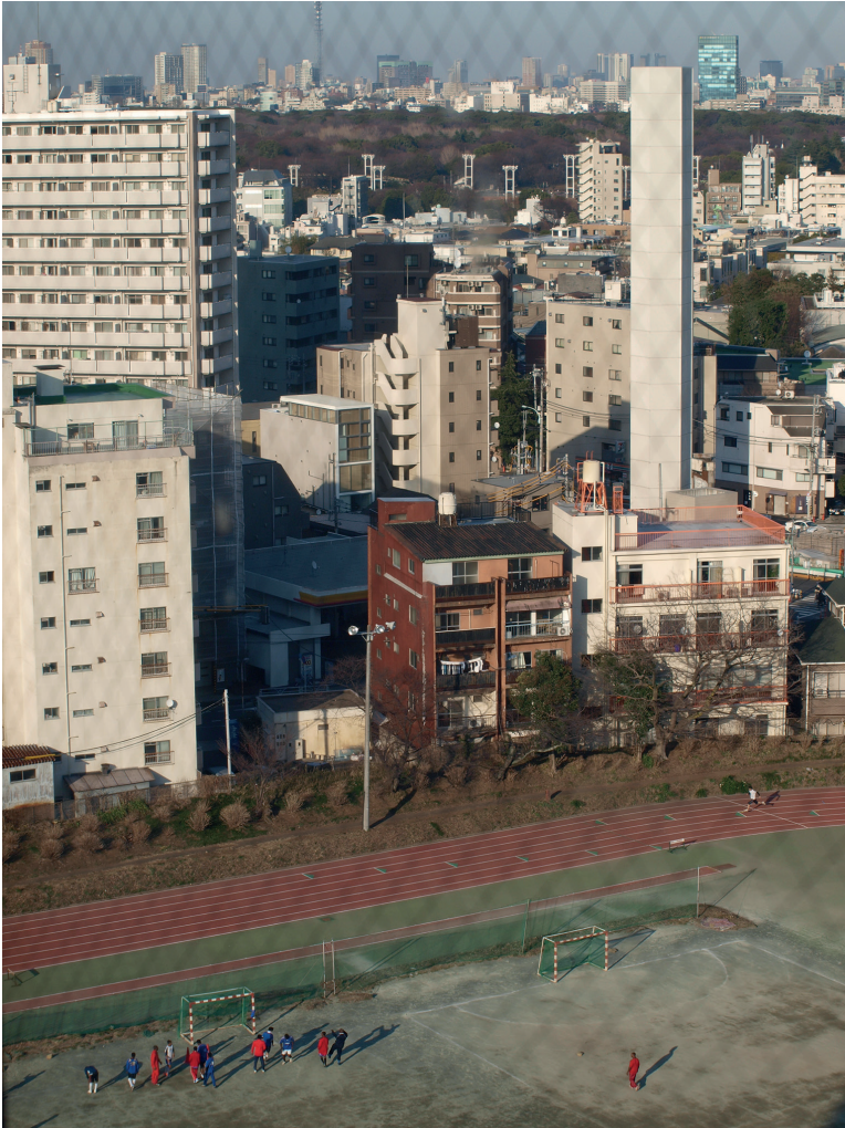
Tokio, 13. 3. 2011, Aufnahmen des Autors.