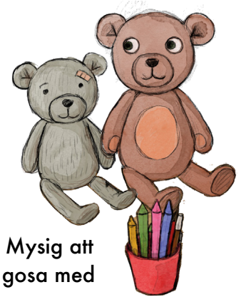
21. Mysig att gosa med

Illustration: Tina Landgren ur Mysteriet bland höghusen