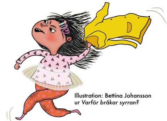
Illustration: Bettina Johansson ur Varför bråkar syrran?