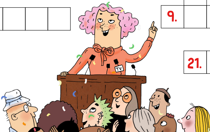
Illustration: Maria Källström ur Kluriga ordens ABC