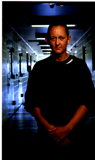
Correction extrait d'une installation vidéo 2004

Along with the recording of time passing, the change from one medium to another neutralizes any attempt to identify the typology as predominant over the phenomenological experience of the image. At loose ends in front of the camera, the subjects are freed, even if momentarily, of the need to be socially accepted through their work. Although it does not erase singularities, this inactivity also constitutes a measurement of commonality between individuals.