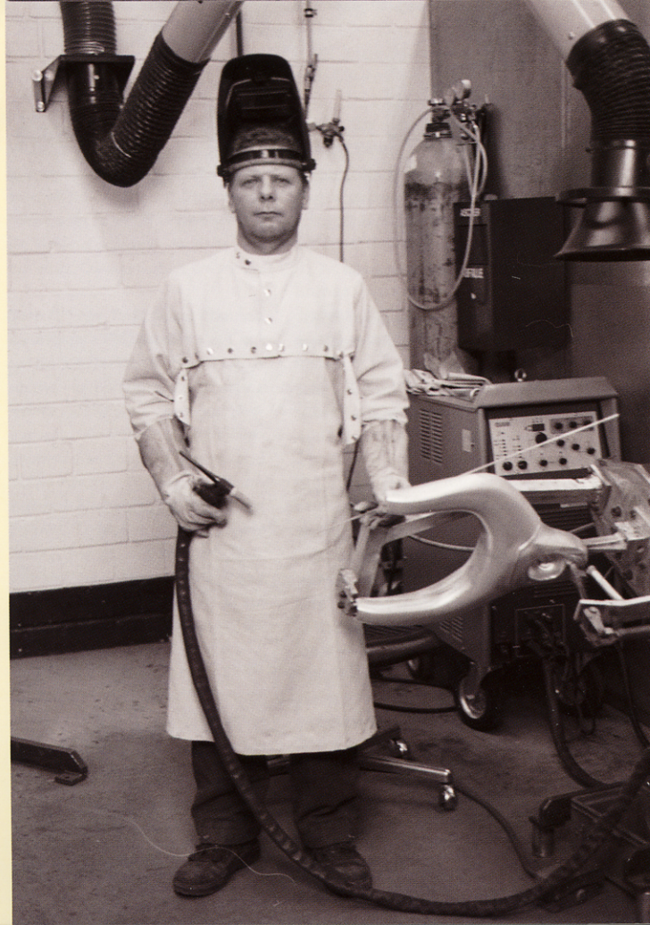
page 12 Countenance (Butcher) Countenance (Welder) extraits d'une installation vidéo 2001