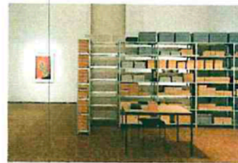
Fiona Tan reinszeniert das Agfa-Archiv im Ausstellungsraum des Museum Ludwig, mitsamt der originalen Regale, Kartons, Ordner und Kisten.

Fiona Tan. GAAF Bis 11. August 2019 Museum Ludwig Heinrich-Böll-Platz, 50667 Köln ► www.museum-ludwig.de