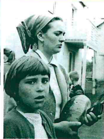
Alle Bilder: Agfa Werbeaufnahmen, 1950/60er-Jahre Vorherige Doppelseite: Fiona Tan, Vox Populi London, 2012