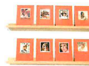
Tan präsentiert zudem Fototaschen mit Bildern aus der Zeit 1952–1968, die im Kontext auch einen kritischen Blick auf die Wirtschaftswunder-Bildsprache werfen.