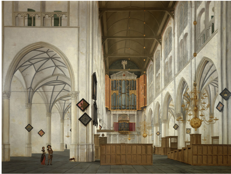
Zo schilderde Pieter Saenredam de Grote Sint Laurenskerk.