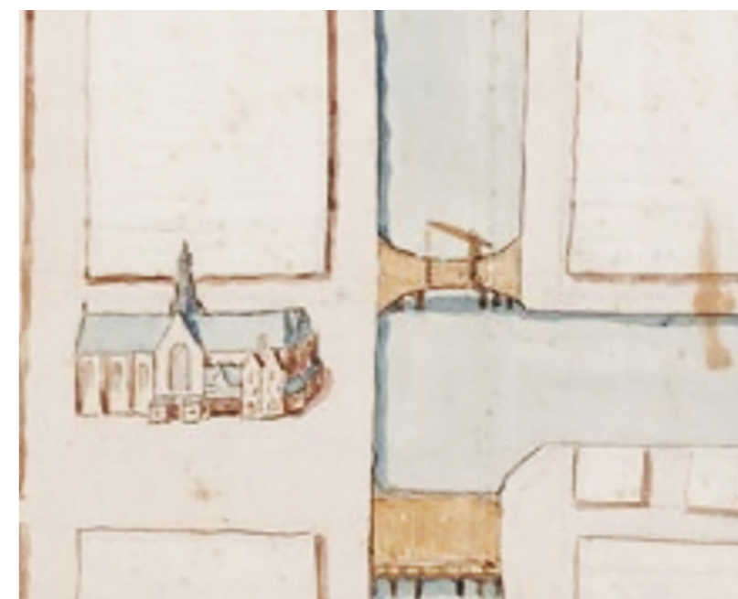
Plattegrond 'Heiligegeestgasthuis aan de Houttille'.

Als vooral de weldoeners het doelwit waren van de wandaden zou er een andere, misschien wel een politieke, uitleg mogelijk zijn voor die vernielingen. Mijn onderzoek verplaatste zich vervolgens naar het Regionaal Archief Alkmaar. Ik hoopte de