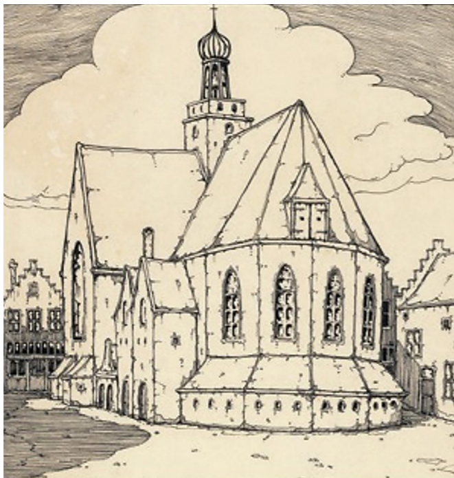
Reconstructie van het 'Heyligher Geesthuys'