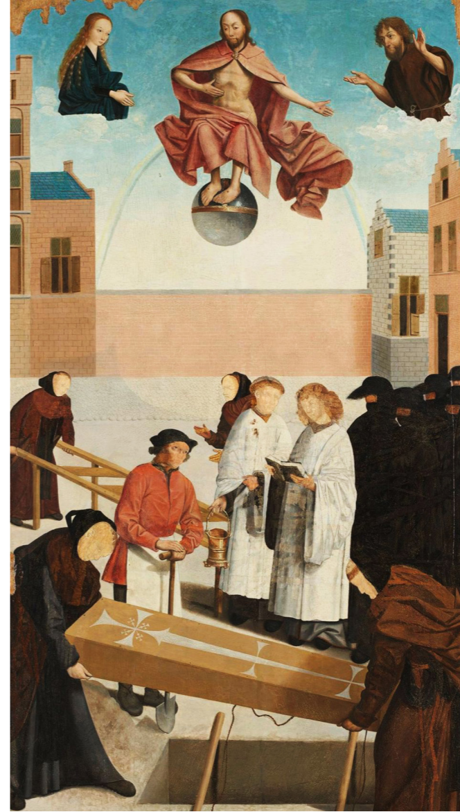
Het vierde tafereel zoals het te zien is in het Rijksmuseum.

'Het middelste paneel is bovendien nog op een geheel andere wijze toegetakeld. De verf werd daar over de figuren heen met driftige bewegingen weg geschraapt in lange stroken ter breedte van ongeveer