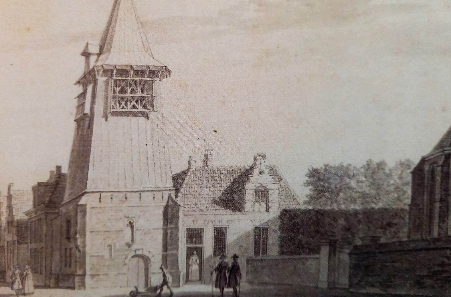
< Tekening van Cornelis Pronk van de houten klokkentoren aan de Koorstraat.

meter. De Alkmaarse torenfundering is dus van buitengewone proporties. De bouwers moeten destijds wel uitzonderlijke bouwplannen hebben gehad en hoge verwachtingen ten aanzien van de beschikbaar komende financiële middelen! 'Blijkbaar hebben we', zo schrijft Bitter verder, 'te maken met een onvoltooide toren zoals we er in den lande wel meer kennen. De bouw zou bijvoorbeeld gehinderd kunnen zijn door financiële perikelen na de plundering van Alkmaar in 1517. Later heeft men van verdere bouw afgezien en is er alsnog een kloostergebouw over deze onvoltooide torenfundering heen gezet.' Uiteindelijk is de Grote Kerk slechts van een vieringtoren