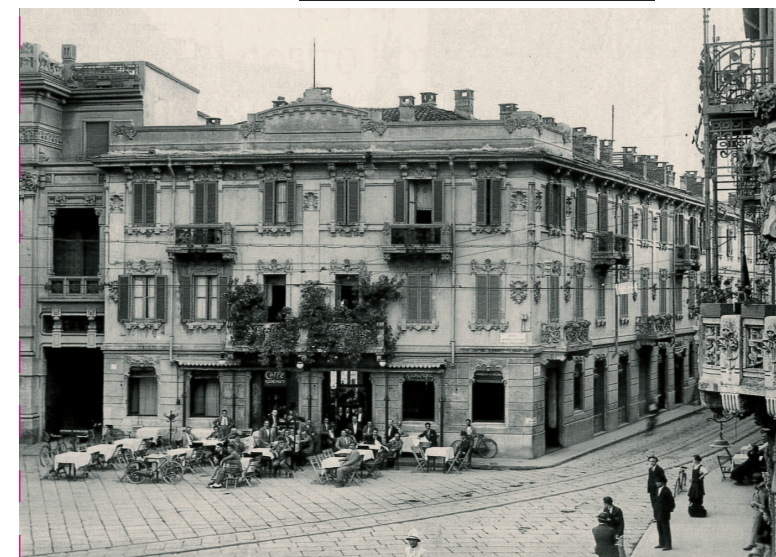
Fotografia del "Caffè Risorgimento" in piazza Garibaldi a Busto Arsizio, primi decenni del Novecento