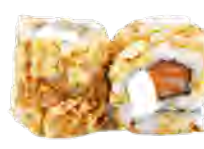
M53 6,50€ Saumon cheese