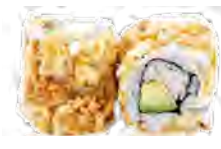
M54 6,50€ Surimi avocat