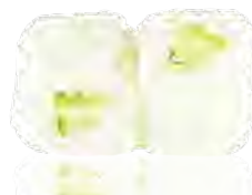
M28 6,00€ Avocat