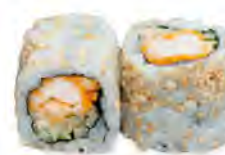
M4 6,50€ Poulet pané, concombre, sauce spicy