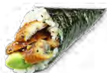
T5 6,50€ Anguille