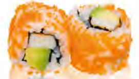
M5 7,50€ Masago Surimi avocat