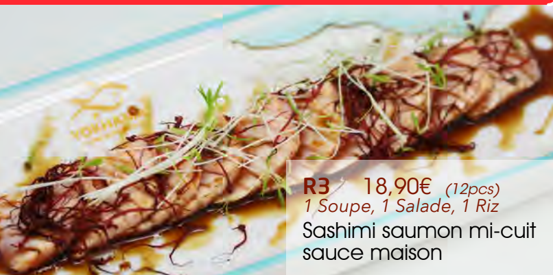
R3 18,90€ (12pcs) 1 Soupe, 1 Salade, 1 Riz Sashimi saumon mi-cuit sauce maison