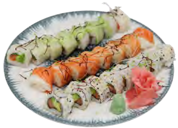
K2 18,90€ 8 printemps roll saumon avcoat, 8 california saumon avcoat, 8 saumon roll cheese