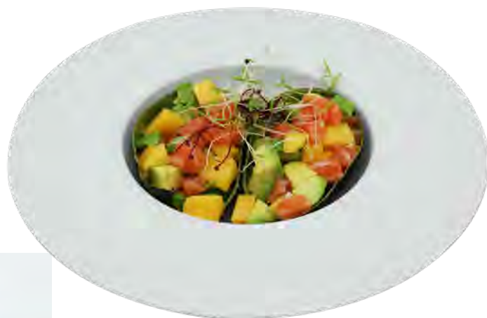
S14 12,90€ Salade mangue saumon avocat