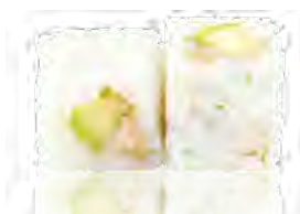
M27 6,00€ Avocat, Thon Cuit