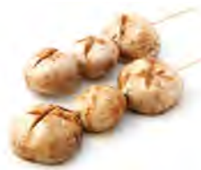
Y3 4,00€ Champignon