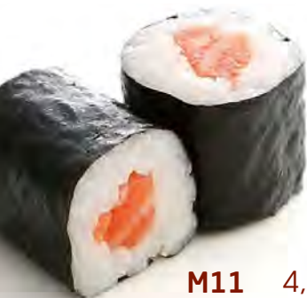
M11 4,50€ Saumon