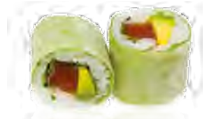
P4 7,00€ Thon Thon, avocat, menthe, coriandre