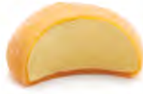
DS2 Mochi glacé (1p) 3,00€