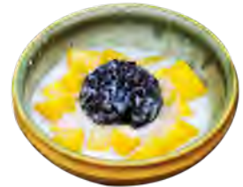
DS6 Mangue fraîche au riz noir et lait de coco 6,90€