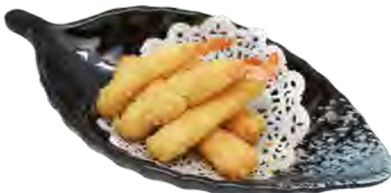
H10 11,90€ Tempura crevettes (6pcs)