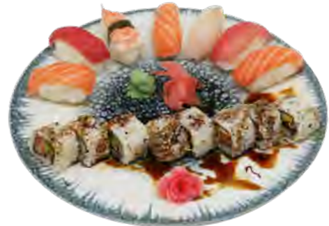
K6 17,90€ 8 california saumon avcoat, 7 sushi assortiment sauce sucré