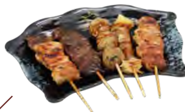
5 Brochettes : 1 bœuf au fromage, 2 poulet, 1 bœuf, 1 boulettes de poulet