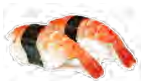
S6 5,50€ Crevettes