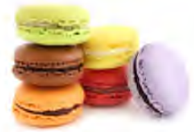
DS9 Macaron (1p) 1,20€