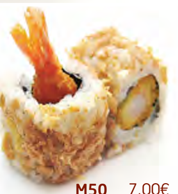
M50 7,00€ Tempura crevettes