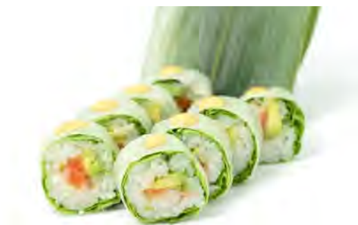
B13 15,90€ 8 printemps saumon, avocat, menthe, coriandre