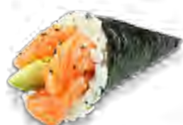
T1 5,50€ Saumon avocat