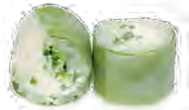
P5 6,00€ Concombre cheese