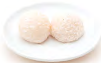
DS8 Perle de Coco 3,80€