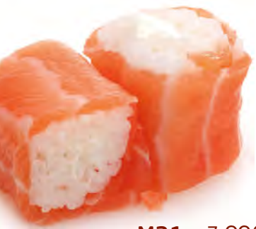
M31 7,00€ Cheese