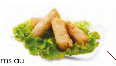
4 nêms au poulet