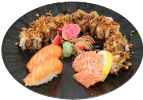
K11 17,90€ 8 crunchy roll, 4 sashimi saumon, 2 sushi saumon