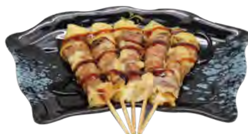
B2 11,90€ 5 Brochettes de bœuf au fromage