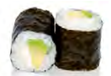
M19 4,50€ Cheese, avocat