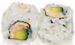
M6 6,00€ Thon cuit avocat