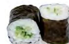
M12 4,50€ Concombre