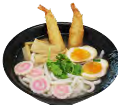
U4 14,90€ Udon tempura crevettes