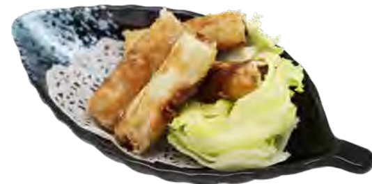
H13 5,90€ 4 Nêms au poulet