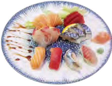
K9 16,90€ 12 sashimi assortiment, 4 sushi assortiment