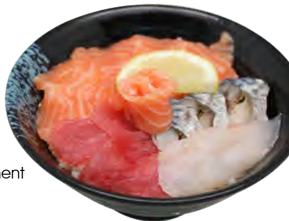
C1 15,90€ Chirashi assortiment