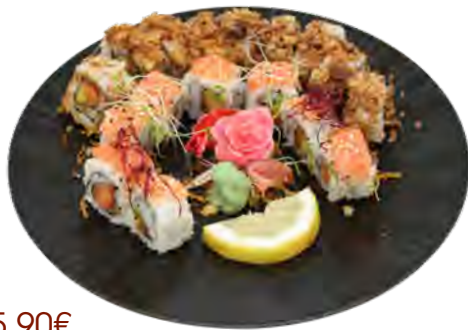
K1 15,90€ 8 pièces de crunchy roll, 8 las vegas