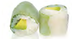
P7 6,00€ Avocat cheese