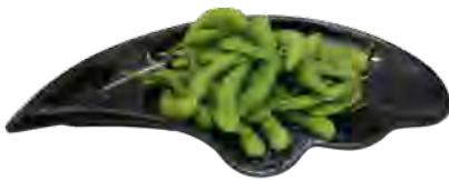
H7 4,50€ Edamamé