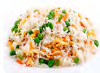
H16 12,90€ Riz sauté légume