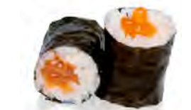
M14 6,50€ Œufs de saumon