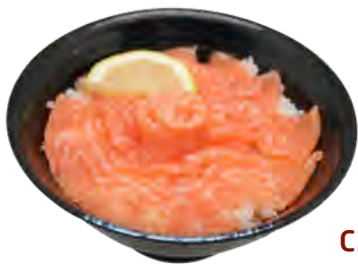
C2 14,90€ Chirashi saumon