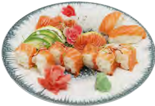
K13 18,90€ 5 sashimi saumon, 3 avocat 2 sushi saumon, 8 saumon roll cheese