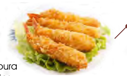
4 tempura crevettes