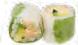
P6 6,00€ Thon cuit avocat