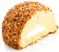
DS1 Mystère 4.90€ Crème glacée aux œufs parfum vanille, Cœur meringue et un enrobage praliné