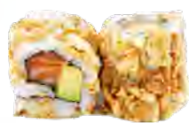
M51 6,50€ Saumon avocat