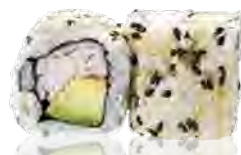
M2 6,00€ Surimi avocat

(Rouleau inversé avec graines de sésame)