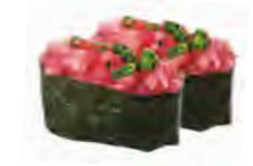
S9 5,50€ Tartare thon