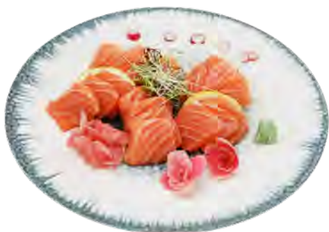
R1 18,90€ Sashimi saumon (16pcs)