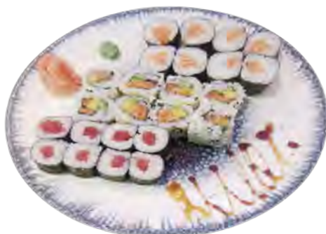
K7 14,90€ 8 maki saumon, 8 maki thon, 8 california saumon avcoat