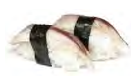
S5 4,50€ Maquereau