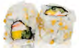
M7 6,50€ Crevette mangue concombre