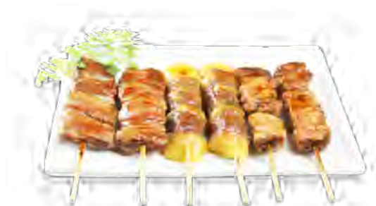
B4 14,90€ 6 Brochettes: 2 Bœuf au fromage, 2 Canard, 2 Poulet