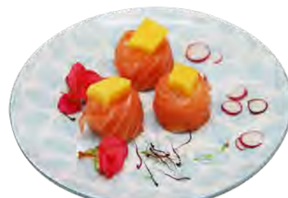
S13 8,00€ Mangue saumon