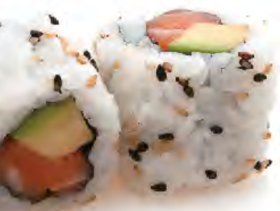
M1 6,00€ Saumon avocat