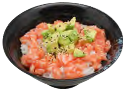
C3 16,90€ Chirashi tartare saumon avocat