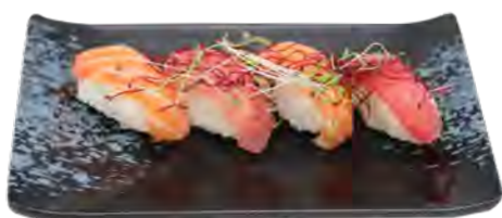
B9 15,90€ 2 sushi saumon, 2 sushi thon