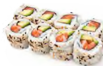
B10 15,90€ 8 california saumon avocat