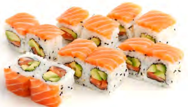
K17 15,90€ 16 las vegas saumon avocat