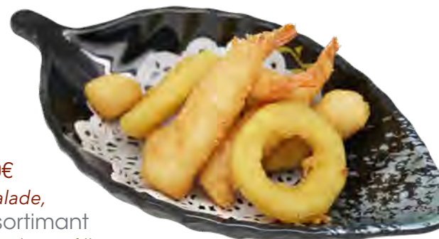
H6 14,90€ 1 Soupe, 1 Salade, Beignet assortiment 3 Tempura, 3 calamar frits 3 beignet de cheese