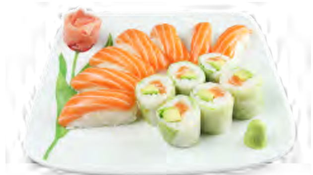
K14 17,90€ 8 Printemps roll saumon, 7 Sushi saumon