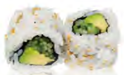
M8 6,00€ Concombre, avocat