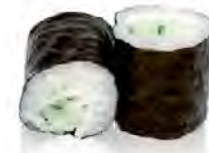
M18 4,50€ Cheese, concombre