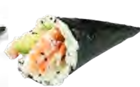
T3 6,50€ Crevette avocat