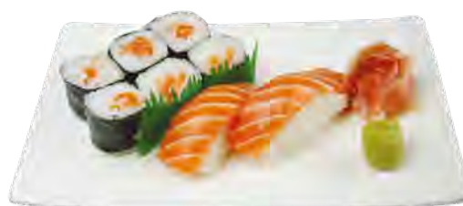
B14 16,90€ 8 maki saumon, 2 sushi saumon