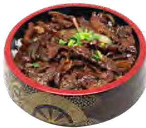
H15 14,90€ Chirashi boeuf, riz nature