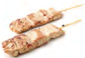
Y5 5,50€ Thon