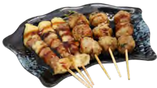
B5 13,90€ 6 Brochettes : 3 bœuf au fromage, 3 boulettes de poulet