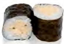
M15 4,00€ Thon cuit