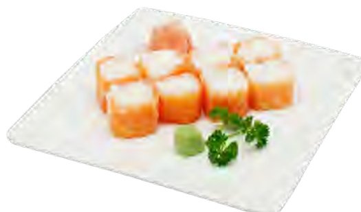
B12 16,50€ 8 saumon roll cheese