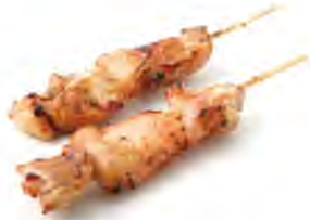
Y2 4,50€ Poulet