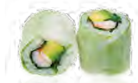
P3 7,00€ Crevette Crevette, avocat, menthe, coriandre