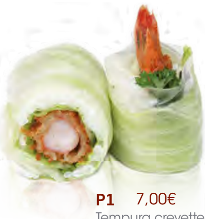
P1 7,00€ Tempura crevette spicy tempura, concombre