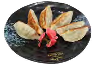
H9 6,90€ Gyoza poulet (6pcs)