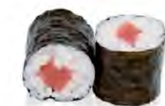
M13 5,50€ Thon