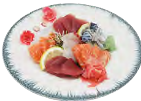
R2 14,90€ Sashimi assortiment (12pcs)