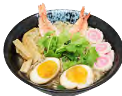
U2 14,90€ Ramen crevettes