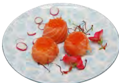
S12 8,90€ Œuf de saumon