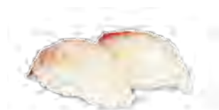
S1 5,00€ Daurade