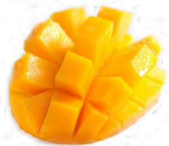
DS5 Mangue Frais 6,90€