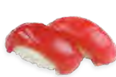
S4 5,00€ Thon