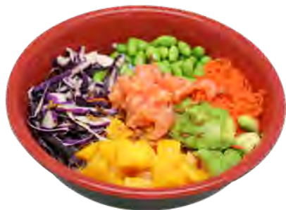
PK1 14,90€ Poke bowl tartare saumon Saumon cru, avocat, mangue, edamamé, carotte, salade chou