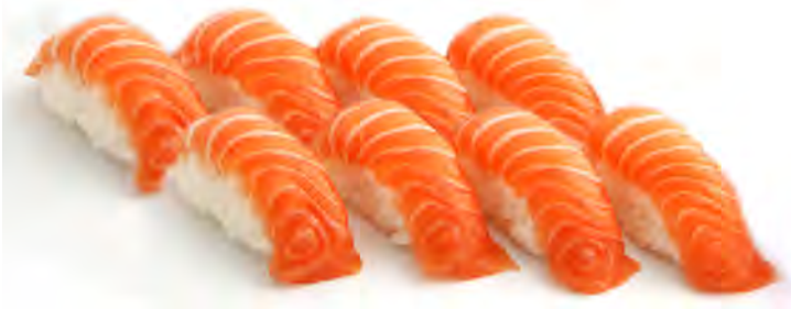
K15 14,90€ 8 Sushi saumon