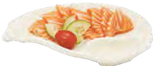
B11 17,90€ 9 sashimi saumon