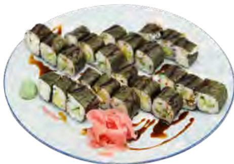
K5 14,90€ 8 maki concombre, 8 maki avcoat, 8 maki cheese sauce sucré