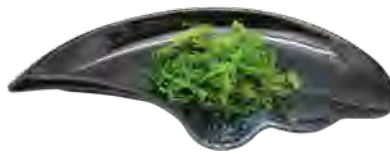
H8 5,50€ Salade d'algues