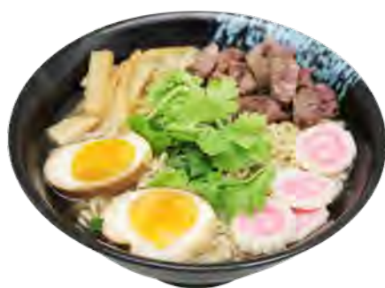
U1 14,90€ Ramen boeuf