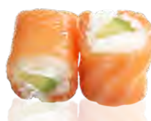
M35 7,50€ Avocat, cheese