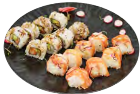
K4 15,50€ 8 california saumon avcoat, 8 saumon roll cheese