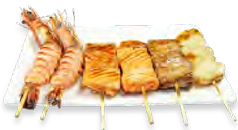
B3 17,90€ 6 Brochettes: 2 Saumon, 2 Gambas, 1 Coquilles St-Jacques, 1 Thon