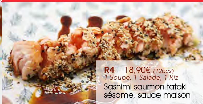
R4 18,90€ (12pcs) 1 Soupe, 1 Salade, 1 Riz Sashimi saumon tataki sésame, sauce maison