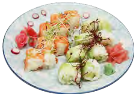
K3 15,50€ 8 saumon roll cheese, 8 printemps roll saumon avcoat