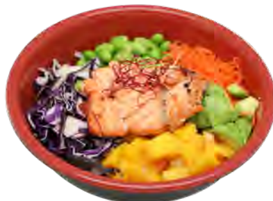
PK2 14,90€ Poke bowl saumon grillé Saumon cuit, avocat, mangue, edamamé, carotte, salade chou