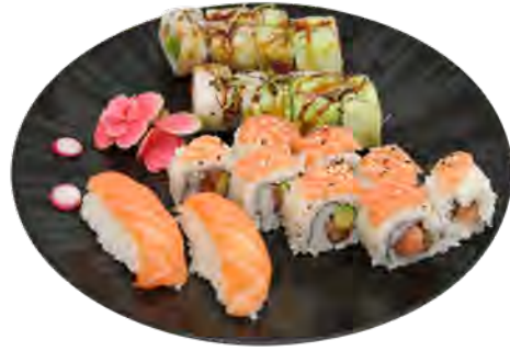
K10 17,90€ 8 printemps roll saumon avocat, 8 las vegas 2 sushi saumon