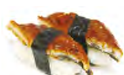
S3 6,50€ Anguille