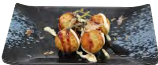
H11 6,50€ Takoyaki (4pcs)