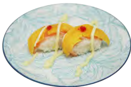
S11 8,00€ Sushi mangue