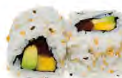
M3 7,00€ Thon, mangue, avocat