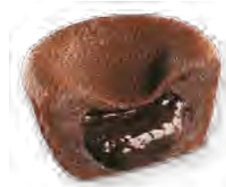
DS3 Fondant Chocolat 3,50€