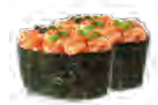
S10 5,00€ Tartare saumon