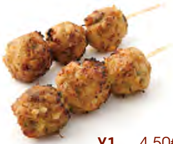
Y1 4,50€ Boulettes de poulet