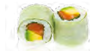
P2 7,00€ Saumon Saumon, avocat, menthe, coriandre

(Riz et poisson enroulés dans une feuille de riz et de laitue à la façon des "rouleaux de printemps")