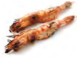
Y8 6,90€ Gambas