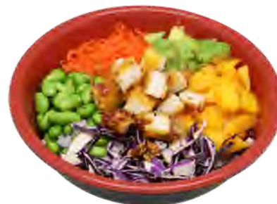
PK3 13,90€ Poke bowl poulet pané Poulet pané, avocat, mangue, edamamé, carotte, salade chou