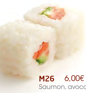
M26 6,00€ Saumon, avocat