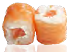
M33 7,50€ Saumon, cheese

(Rouleaux de cream cheese enrobés de riz et de saumon)