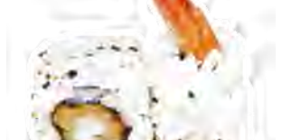
M10 7,00€ Tempura crevettes