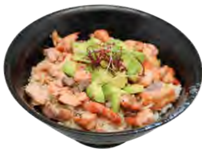
C4 16,90€ Chirashi saumon cuit avocat