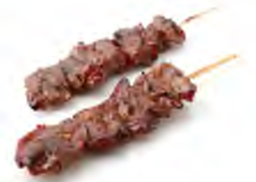
Y4 4,50€ Boeuf