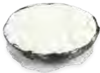
DS4 Coco givrée 4,90€