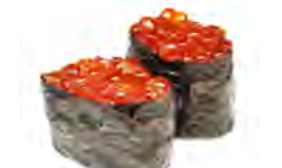
S8 6,00€ Œufs de saumon