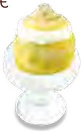
DS7 Citron givrée 4,90€