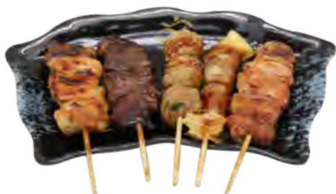
B1 10,90€ 5 Brochettes : 1 bœuf au fromage, 2 poulet, 1 bœuf, 1 boulettes de poulet