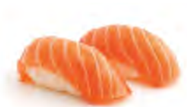
S2 4,50€ Saumon