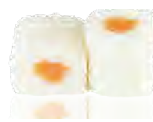
M29 6,00€ Saumon