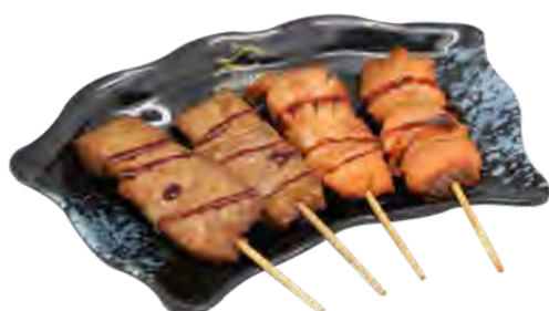
B7 12,90€ 4 Brochettes : 2 saumon, 2 thon