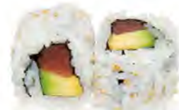
M9 6,50€ Thon avocat