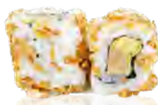
M52 6,50€ Thon cuit mayo avocat