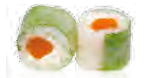
P8 7,00€ Saumon cheese