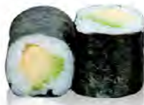
M16 4,50€ Avocat