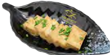
H5 6,90€ Beignet de tofu