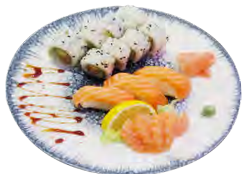
K8 16,90€ 8 california saumon avcoat, 3 sushi saumon, 4 sashimi saumon