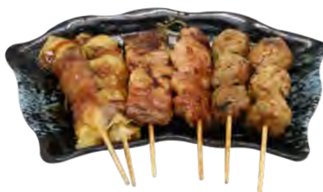
B6 13,90€ 6 Brochettes : 2 poulet, 2 bœuf au fromage, 2 boulettes de poulet