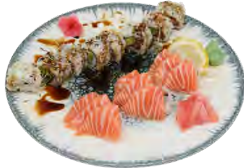
K12 18,90€ 8 california saumon avocat, 9 sashimi saumon