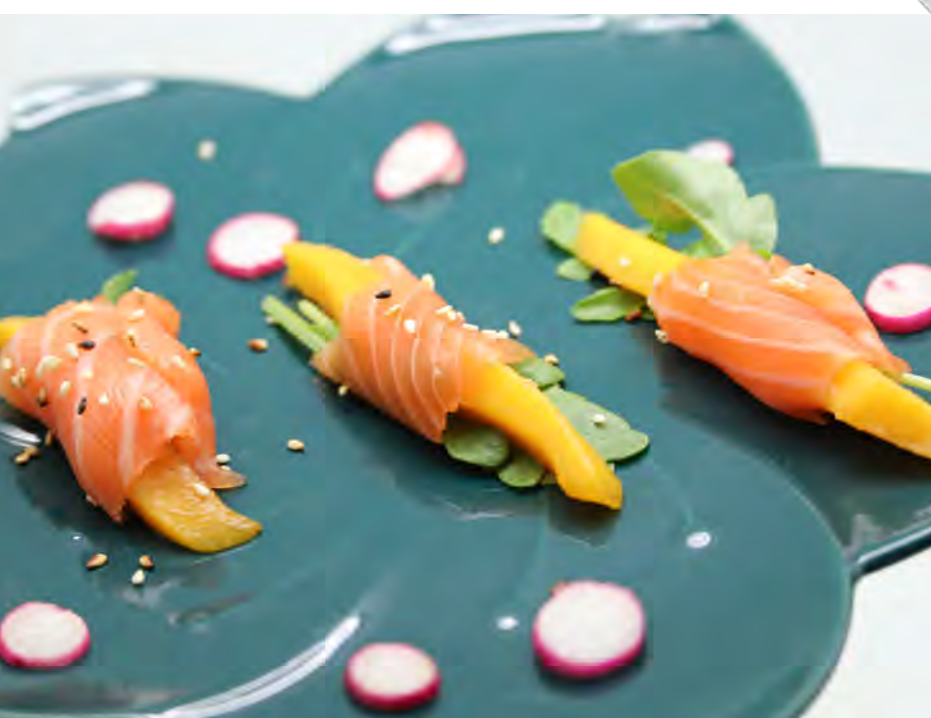
S15 6,90€ Saumon mango, légume