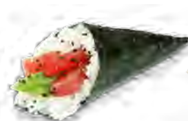
T2 6,00€ Thon avocat