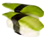
S7 4,50€ Avocat