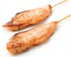
Y6 6,00€ Saumon