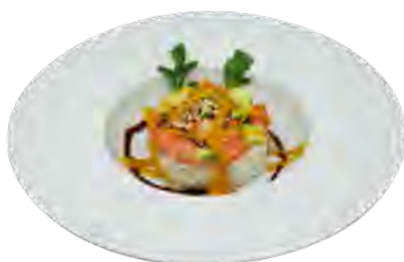
H12 11,90€ Tartare saumon avocat mangue riz vinaigré sauce mangue