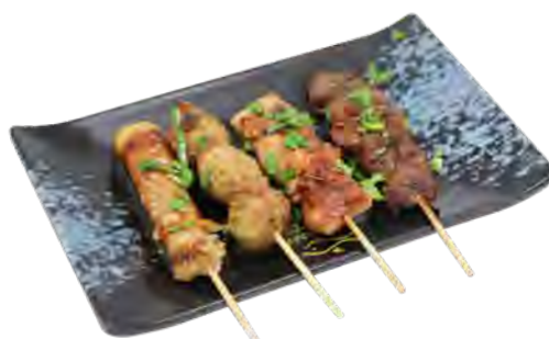
B8 9,90€ 4 Brochettes : 1 bœuf au fromage, 1 poulet, 1 boulettes de poulet, 1 bœuf