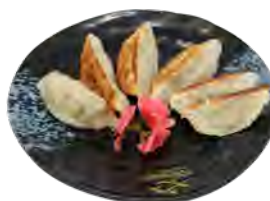
6 Gyoza poulet