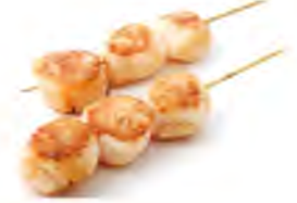
Y9 6,90€ St- jacques