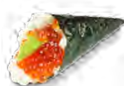
T4 7,00€ Œufs de saumon