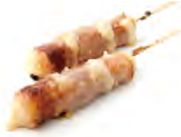
Y7 5,00€ Boeuf au fromage