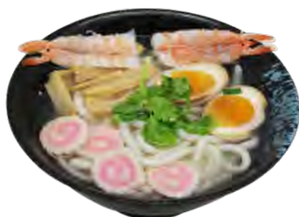
U3 14,90€ Udon crevettes piquante