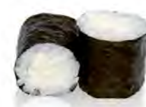
M17 4,50€ Cheese