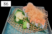
86 CRISPY EBI ROLLS frittierte Garnele, Lachstartar, Kataifi, Teriyaki 2,3,9,13,a,b,c 13,80€