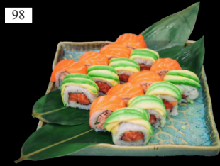
98 MIX ROLLE verschiedene Rollen vom SUSHI CHEF 2,4,9,13,a,c,d,g 19,80€