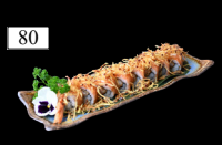
80 CHEDDAR ROLLS Tempura Garnele, Avocado, Käse, spicy Mayo, Teriyaki 1,2,4,11,a,b,c,g,j 14,80€