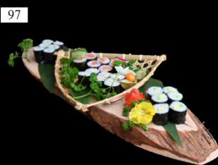
97 MAKI MIX 6x SAKE MAKI 2,d 6x GURKE MAKI 6x AVOCADO MAKI 6x CALIFORNIA MAKI 3,n 16,80€