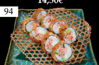
94 SALMON ROLLS frittiert, gekochter Lachs, Teriyaki, Avocado, „Phila“, scharfe Mayo 2,4,6,a,c,d,f,g 13,50€