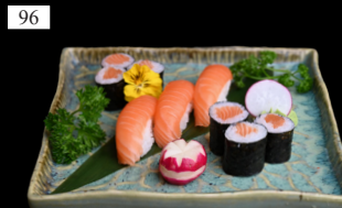
96 SAKE MIX 6x SAKE MAKIS 2,d 4x SAKE NIGIRIS 2,d 14,50€