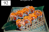
92 MANGO CHILI ROLL Lachs, flambierter Lachs, Mango, scharfe Mayo, Teriyaki, Sesam 1,2,6,13,d,j,k 14,50€