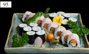
95 VEGGIE MIX 8x YASAI ROLLS 6x GURKE MAKI 6x AVOCADO MAKI 16,00€