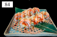
84 FRAMBEE ROLLS Avocado, Lachstartar, flambierter Lachs, Miso Mayo, Pistazien 2,11,d,j,k 14,80€