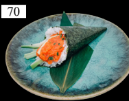
70 TEMAKI SPICY SAKE Lachstartar, Gurken, scharfe Mayo 1,2,d,j 5,90€