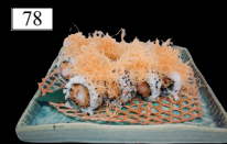
78 EBITEN ROLLS frittierte Garnele, „Phila“, Kataifi, Teriyaki 1,3,9,13,a,b,c,k 12,80€