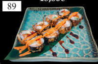
89 FREI ROLLS frittierte Rolle, Garnelen, Avocado, Teriyaki 1,4,9,13,a,b,c 13,80€