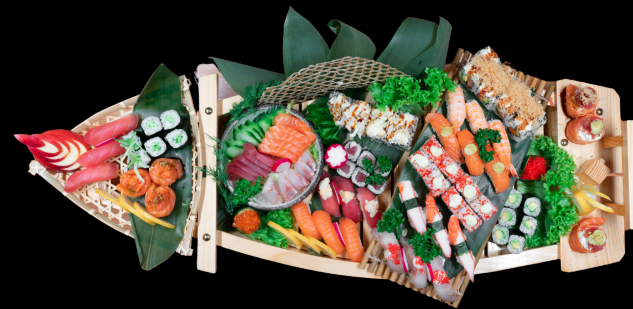
99 RHEIN KUTTER 16 Stück Mix Sushi 1x Nigiri | 1x Gunkan | 8x Uramaki 6x Hosomaki 2,3,4,6,9,11,13,14,a,b,c,d,f,g,k 22,90€