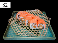
82 TIGER ROLLS frittierte Garnele, Lachs, Mayo, Teriyaki 2,3,9,13,a,b,d,j 13,80€