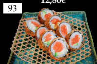
93 SAKE FLY ROLLS frittierte Rolle, Lachs, Avocado, „Phila“, scharfe Mayo, Teriyaki 2,3,6,a,c,d,f,g 14,50€