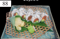
88 SPICY TUNA ROLLS Tuna, Gurken, Tobiko, scharfe Mayo 2,d,j,k 12,80€