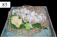
85 MIURA ROLLS gekocht. Lachs, „Phila“, Avocado, Tobiko, Teriyaki 2,3,4,11,d,g,k 10,80€