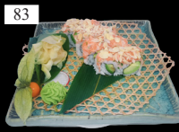
83 ROCK'N ROLLS Avocado, „Phila“, Lachstartar, Mandeln 2,4,11,d,g 13,80€