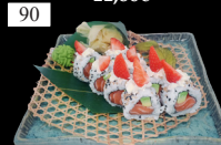
90 ICHIGO ROLLS Lachs, Avocado, „Phila“, Teriyaki, Erdbeere, Sesam 2,4,6,13,d,g,k 12,80€