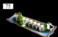
75 PHILADELPHIA TUNA ROLLS Thunfisch, Avocado, Sesam 2,4,6,d,g,k 11,80€