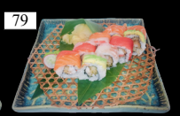
79 RAINBOW ROLLS frittierte Garnele, Teriyaki, Fischsorte-Mix 2,3,4,9,b,d 13,80€