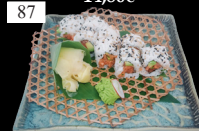
87 SPICY SAKE ROLLS Lachstartar, Gurken, Tobiko, scharfe Mayo 2,d,j,k 11,80€