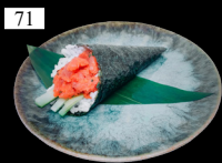
71 TEMAKI SPICY MAGURO Tuna-Tartar, Gurken, scharfe Mayo 1,2,d,j 5,90€