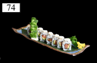
74 PHILADELPHIA SAKE ROLLS Lachs, Avocado, Sesam 2,4,6,d,g,k 9,80€