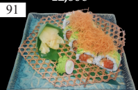
91 FERVER ROLLS Lachs, „Phila“, Avocado, Kataifi, Teriyaki 2,4,9,13,a,c,d,g 14,50€