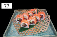
77 TUNA ROLLS Thunfisch, Avocado, Tobiko 2,d,n 12,80€