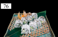
76 CALIFORNIA ROLLS Garnelen, Avocado, Gurken 3,b,g,k 10,80€