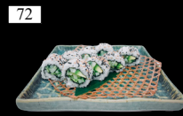
72 YASAI ROLLS Gurke, Salat, Avocado, Sesam 6,k 8,80€