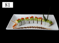
81 DRAGON ROLLS Tempura Garnele, Avocado, Gurke, spicy Mayo, Teriyaki 2,11,a,b,c,j 12,80€