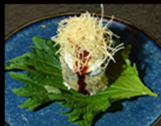
130. Hosomaki fritto 5.00€

avvolto panko fritto in tempura, salmone, formaggio, salsa teriyaki, pasta kataifi Allergeni: 2,3,4,6