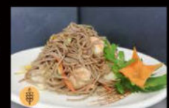
209. Soba con gamberi* 6.00€ Allergeni: 1,2