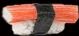
55. Nighiri granchio 2.50€