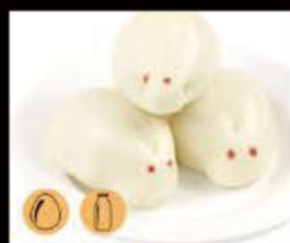
19. Pane crema 2.50€ Allergeni: 1,3,7