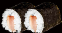
123. Hosomaki Suzuki 5.00€