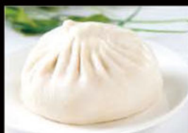
14. Baozi 4.50€ Allergeni: 1,6