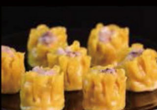
11. Ravioli speciale 5.00€ Allergeni: 1,6