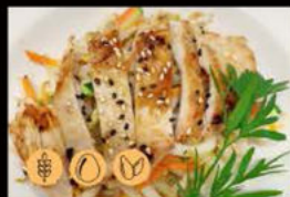
199. Udon con Pollo e Verdure 7.00€ Allergeni: 1,11