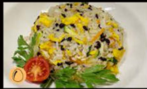
191. Yasai meshi 4.50€ riso bianco con verdure miste Allergeni: 3