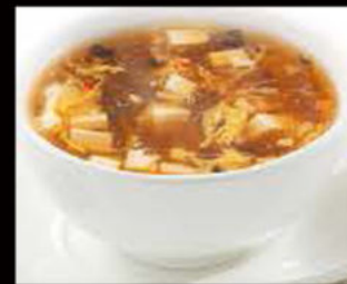
51. Zuppa Agro-Piccante 3.80€ Allergeni: 1,3,6