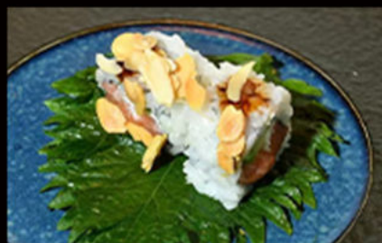
105. Uramaki mandorle 8.50€

avocado, gambero fritto, maionese, salmone on top scottato alla fiamma, salsa teriyaki, granella di tempura Allergeni: 1,2,3,4,6