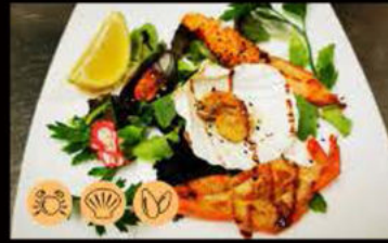
224. Gamberoni* 11.00€