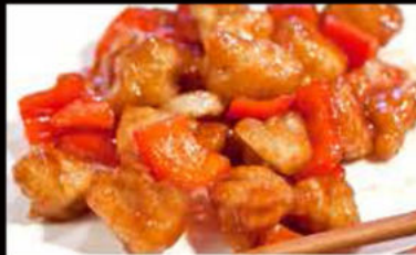
244. Pollo in salsa Agrodolce 5.00€