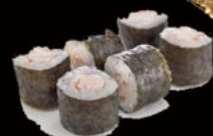
122. Hosomaki ebi 4.50€