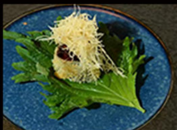
129. Hosomaki sake fritto 5.50€

hosomaki fritto con pesce bianco, avocado, philadelphia, crema di tartufo, salsa teriyaki Allergeni: 4,6,7