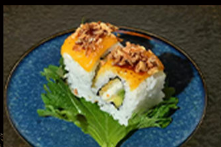
119. Cheese chicken 11.00€

salmone, avocado, philadelphia, formaggio scottato alla fiamma, salsa teriyaki, cipolla fritta, erba cipollina Allergeni: 4,6,7