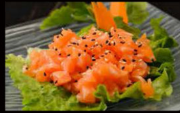
41. Tartare sake 8.00€ salmone, avocado, salsa tartare, sesamo Allergeni: 3,4,10,11