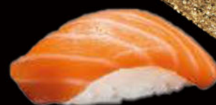
56. Nighiri salmone 3.00€