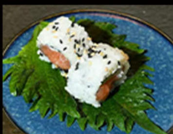
86. Uramaki philadelphia 7.00€ salmone, philadelphia, avocado, semi di sesamo Allergeni: 3,4,11