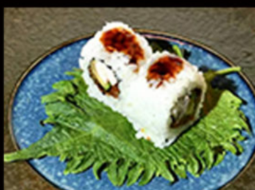
90. Uramaki unagi 8.00€ avocado, anguilla, gambero cotto, semi di sesamo, salsa teriyaki Allergeni: 2,4,6,11