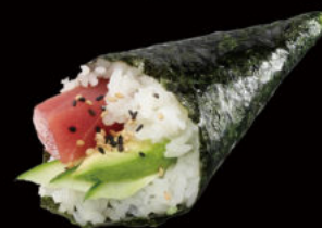
144. Temaki tonno 4.50€ tonno cotto, philadelphia, maionese, avocado, cetrioli, sesamo Allergeni: 3,4,7,11