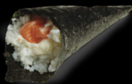
139. Temaki philadelphia 4.00€ salmone, philadelphia, avocado, sesamo Allergeni: 4,7,11