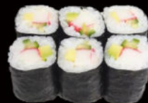
127. Hosomaki california 4.50€

cetriolo, surimi di granchio Allergeni: 2