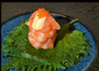
153. Gio spicy salmone 5.50€ salmone,tobiko,mayo piccante, erba cipollina,tobbiko Allergeni: 3,4