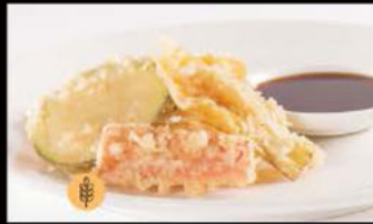
212. Yasai Tempura 5.00€