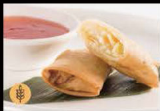
2. Involtini primavera 2.50€ Allergeni: 1