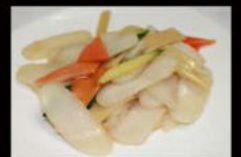
208. Gnocchi di riso con verdure 4.50€