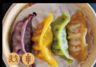
9. Ravioli quattro colore 4.50€ Allergeni: 1,6