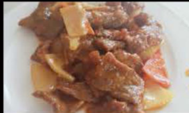
247. Vitello in salsa sacha 6.90€