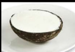
Cocco ripieno 6.00€