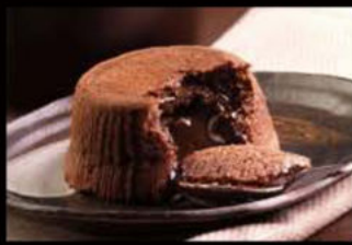
Soufflé al cioccolato 5.00€