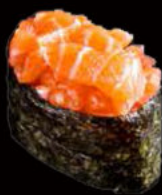
146. Gunkan sake 3.00€ alga,salmone,maionese piccante, erba cipollina,sesamo Allergeni: 3,4,11