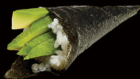
134. Temaki avocado 3.00€ philadelphia, avocado, sesamo Allergeni: 7,11