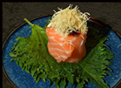
161. Gio kadaifi 4.50€ salmone,philadelphia,salsa teriyaki,pasta kadaifi Allergeni: 1,4,6,7