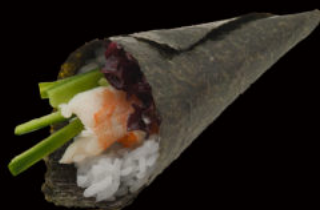
142. Temaki ebi 4.00€ maionese, avocado, maionese, gambero cotto, sesamo Allergeni: 3,4,11