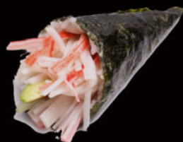
143. Temaki california 4.00€ maionese, avocado, cetrioli, surimi di granchio, sesamo Allergeni: 2,3,11