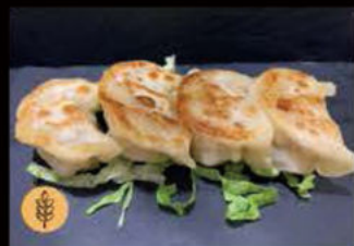
6. Ravioli al Griglia 4.50€ Allergeni: 1,6