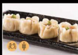
13. Shaomai 5.00€ Gamberi, carne, carote, piselli Allergeni: 1,2,3,4,6