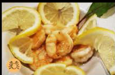
234. Gamberi* con limone 6.50€