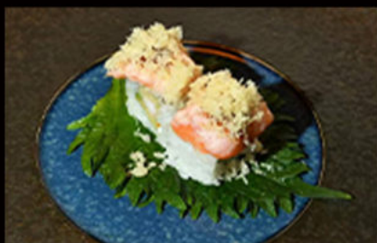
103. Uramaki ebi salmone 9.00€

avocado, gambero fritto, maionese, salmone on top scottato alla fiamma, salsa teriyaki, granella di tempura Allergeni: 1,2,3,4,6