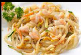
198. Udon con gamberi e Verdure 7.00€ Allergeni: 1,2