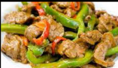
246. Vitello in salsa Piccante 6.90€