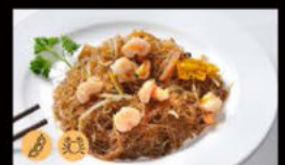
206. Spaghetti di soia con gamberi* e verdure 5.00€ riso con prosciutto cotto,piselli Allergeni: 2,6