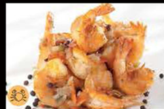
230. Gamberi* in salsa e pepe 6.50€