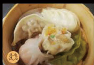
10. Ravioli miste 4.50€ Allergeni: 1,6