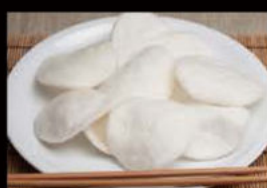
15. Nuvolette di Drago 2.50€