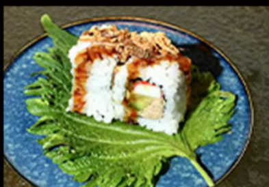
89. Uramaki oishi 8.00€ surimi di granchio, cetriolo, avocado, maionese, tonno cotto, granella di tempura, salsa teriyaki Allergeni: 1,2,3,4,6