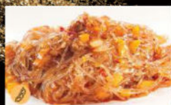
205. Spaghetti di soia con carne e verdure piccante 5.00€ Allergeni: 2,3