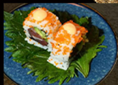
88. Uramaki spicy tuna 8.00€ cetrioli, avocado, tonno rosso, mayo piccante, semi di sesamo, uova tobiko, erba cipollina Allergeni: 3,4,11