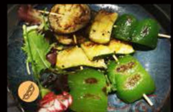
220. Verdure miste alla piastra salsa teriyaki 5.00€