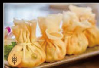
12. Fagottini fritti 4.50€ Allergeni: 1