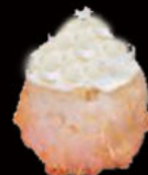
151. Gunkan philadelphia 3.00€ riso,philadelphia,sesamo Allergeni: 7,11