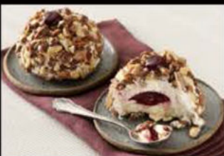
Croccante all'amarena 5.00€