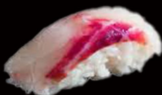
57. Nighiri branzino 3.00€