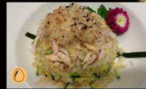
192. Riso con Pollo 6.00€ riso con pollo verdure Allergeni: 2