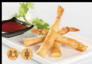
1. Hakimaki 4.00€ Involtini di gamberi Allergeni: 1,2