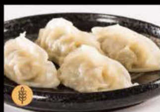
5. Ravioli con Carne 4.50€ Allergeni: 1,6