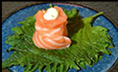
152. Gio salmone 5.00€ salmone,maionese,semi di sesamo Allergeni: 3,4,11

Ogni piatti massimo 1 porzione a persona