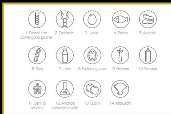
TABELLA ALIMENTI CHE CONTENGONO ALLERGENI

Alcuni ingredienti dei nostri piatti ( contrassegnati con un *) potrebbero essere surgelati all'origine o acquistati freschi surgelati da noi con abbattitore di temperatura per la corretta conservazione nel rispetto della normativa sanitaria.