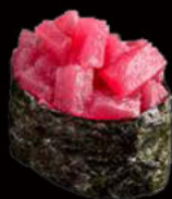
147. Gunkan tuna 3.50€ alga nori,tonno rosso,maionese piccante, erba cipollina,sesamo Allergeni: 3,4,11