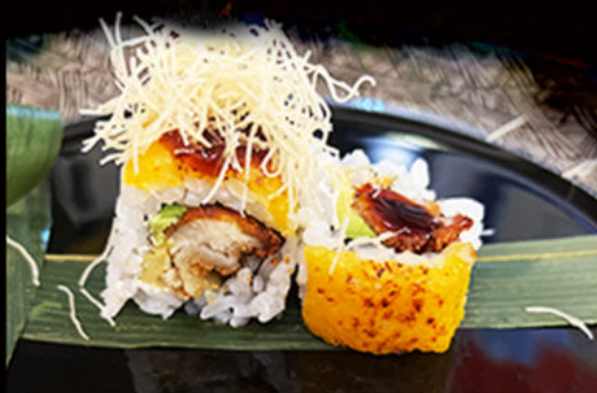
92. Uramaki chicken 7.00€ pollo fritto, philadelphia, avocado, formaggio, salsa teriyaki, maionese piccante, pasta kataifi Allergeni: 1,3,6,7