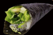
135. Temaki veggy 4.00€ avocado, cetrioli, insalata, insalata, goma wakame, sesamo Allergeni: 11