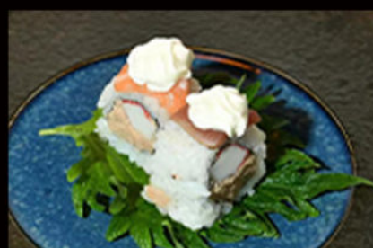
111. Uramaki rainbow 11.00€

gambero fritto, gamberi cotti, mayo piccante, tartare di salmone, salsa teriyaki, scaglie di mandorle Allergeni: 2,3,4,6,8