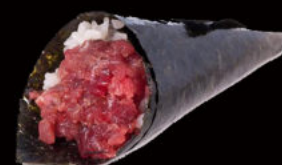
141. Temaki spicy maguro 5.00€ avocado, maionese piccante, cetrioli, erba cipollina, tonno rosso, tobiko Allergeni: 3,4