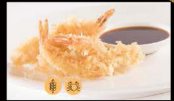
213. Ebi Tempura 8.00€