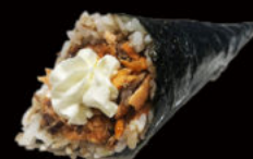
138. Temaki miura 4.00€ philadelphia, pesce cotto, avocado, sesamo, salsa teriyaki Allergeni: 4,6,7,11