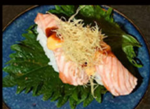
60. Nighiri salmon flambé 3.50€

salmone, salsa flambé, mayo piccante, salsa teriyaki, erba cipollina, pasta kataifi