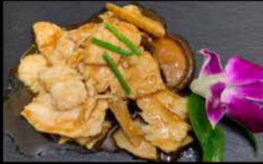
240. Pollo con bambù e funghi 5.50€