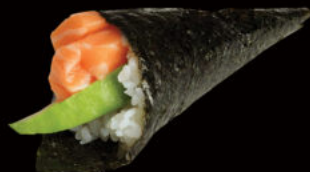
136. Temaki salmon avocado 4.00€ avocado, salmone, sesamo Allergeni: 4,11