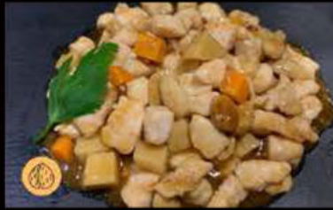
241. Pollo con Mandorle 5.50€ Allergeni: 8