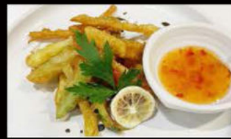
216. Tempura Verdure 4.00€