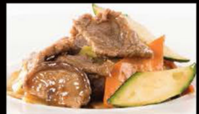
248. Vitello con bambù e funghi 6.90€