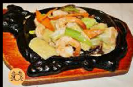
233. Gamberi* con verdure miste 7.00€