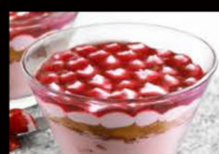
Coppa cheesecake monterosa 5.50€