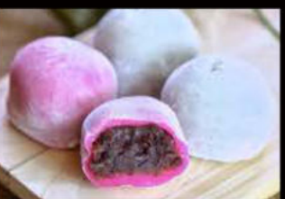
Mochi 5.00€ (mango, fragola, vaniglia, sesamo, cioccolato, tè verde, cocco)