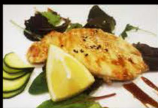
223. Pollo alla Griglia 7.00€