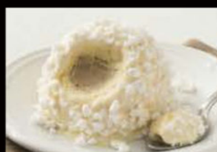
Tartufo bianco 5.00€