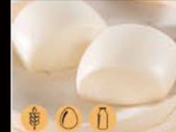
17. Pane al Vapore 2.50€ Allergeni: 1,7