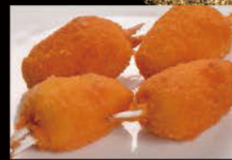
4. Polpa di Granchio 3.50€ Allergeni: 1,2