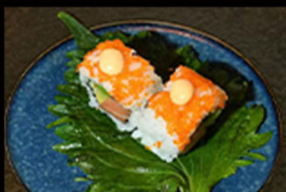
87. Uramaki spicy sake 7.00€ cetrioli, avocado, salmone, mayo piccante, semi di sesamo, uova, tobiko, erba cipollina Allergeni: 3,11