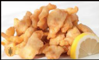
211. Chickrn Furai 5.00€