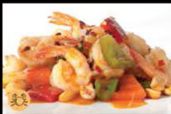
229. Gamberi* in salsa piccante 6.50€