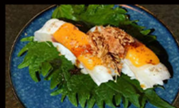
65. Nighiri cheese suzuki 3.50€

pesce bianco, formaggio, teriyaki, cipolla, croccante, erba cipollina