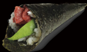
145. Temaki tuna avocado 4.50€ tonno rosso, avocado, sesamo Allergeni: 4,11