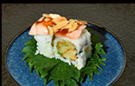
110. Uramaki ebi flambe 12.00€

salmone, philadelphia, avocado, salsa teriyaki, scaglie di mandorle Allergeni: 4,6,7,8