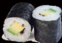
124. Hosomaki avocado 4.00€