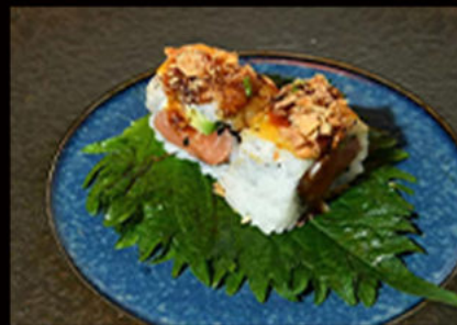
118. Cheese salmone 11.00€

avocado, philadelphia, salmone, crema di tartufo Allergeni: 4,7