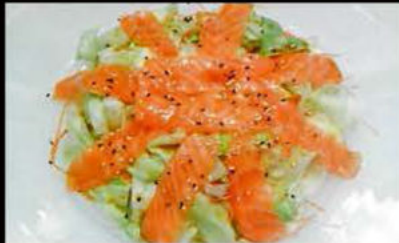
44. Insalata sake 6.50€ misticanza, pomodoro, salmone, sesamo, salsa insalata Allergeni: 4,11