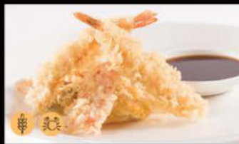
214. Mista Tempura 6.50€