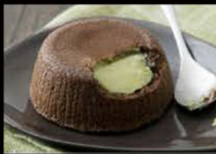
Soufflé al pistacchio 5.00€