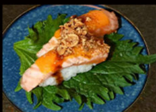
63. Nighiri cheese salmon 3.50€

salmone, formaggio, salsa teriyaki, cipolla croccante, erba cipollina