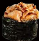
150. Gunkan tonno 3.00€ alga nori,riso,tonno cotto,maionese,sesamo Allergeni: 3,4,11