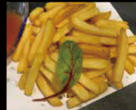
21. Patatine Fritte 2.50€ Allergeni: 1