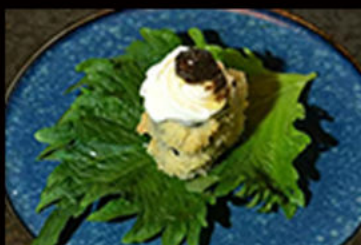
128. hosomaki suzuki fruffle 9.00€

cetriolo, surimi di granchio Allergeni: 2