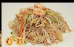
204. Spaghetti di riso con gamberi* e verdure 5.00€ Allergeni: 2,3