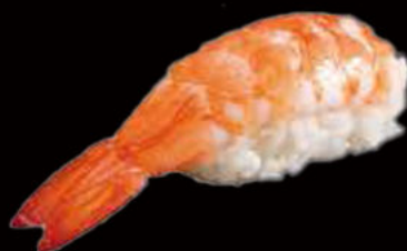
58. Nighiri ebi 3.00€