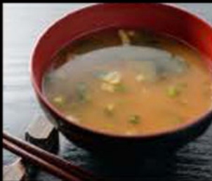
50. Miso shiru 3.00€ soia, alghe, tofu Allergeni: 6