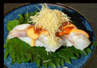
62. Nighiri Suzuki flambé 4.00€

branzino, salsa flambé, mayo piccante, salsa teriyaki, erba cipollina, pasta kataifi