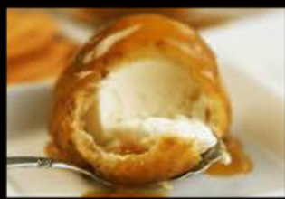
Gelato fritto 3.50€