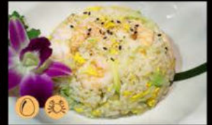
195. Riso con gamberi* e piselli 6.00€ riso con gamberi,verdure miste Allergeni: 2,3