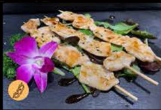
218. Spiedini di pollo salsa teriyaki 6.50€