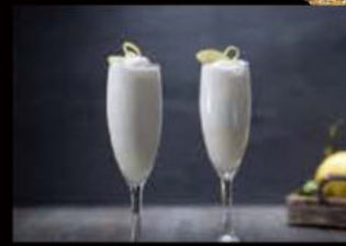
Sorbetto al Limone 3.50€