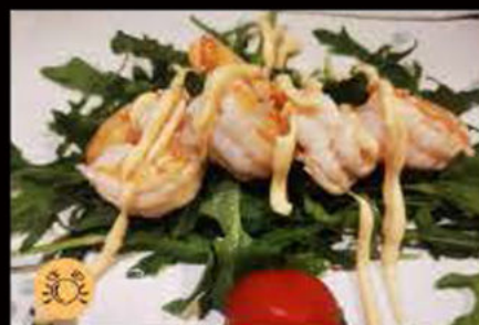
237. Gamberi* con salsa 7.00€