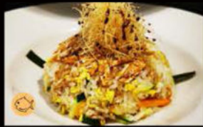
193. Riso saltato salmone 8.00€ riso con salmone,verdure,sesamo Allergeni: 4,11