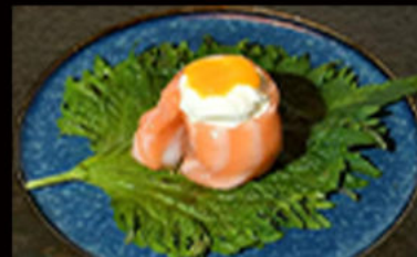
156. Gio philadelphia 4.50€ salmone,philadelphia,semi di sesamo, salsa mango Allergeni: 4,7,11