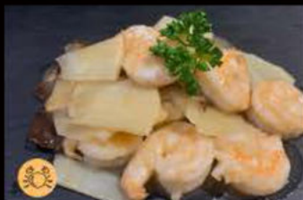
228. Gamberi* con bambù e funghi 6.50€