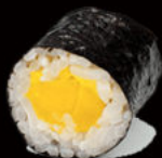
126. Hosomaki mango 4.50€