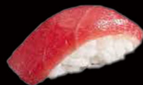
59. Nighiri tonno 3.50€