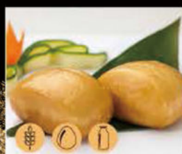
18. Pane Fritto 3.00€ Allergeni: 1,7