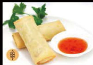
3. Involtini giapponese 5.00€ Allergeni: 1