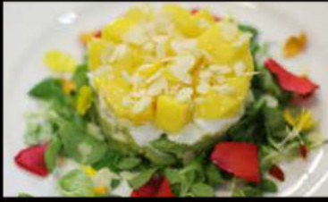
40. Tartare veggy 6.00€ riso, goma wakame, avocado, mango, salsa tartar Allergeni: 3,10

Ogni piatti massimo 1 porzione a persona