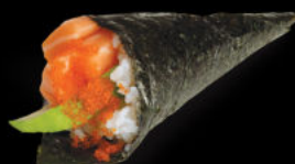
140. Temaki spicy salmon 4.50€ avocado, maionese piccante, cetrioli, erba cipollina, salmone, tobiko Allergeni: 3,4