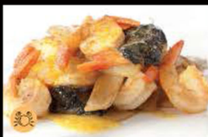
232. Gamberi* in salsa curry 6.50€