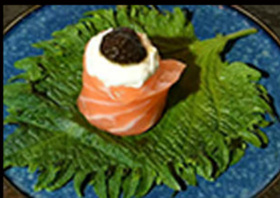
160. Gio tartufo 4.50€ salmone,philadelphia,crema tartufo Allergeni: 4,7