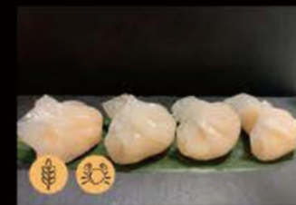
8. Ravioli con Gamberi 5.50€ Allergeni: 1,2