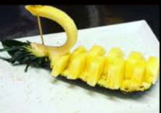
Ananas fresco 3.50€