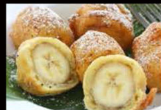
Frutta mista fritta 3.50€