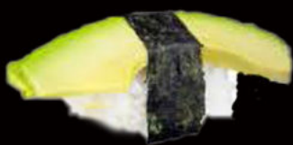
54. Nighiri avocado 2.00€