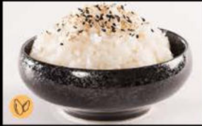
190. Gohan 2.00€ riso bianco,sesamo Allergeni: 11