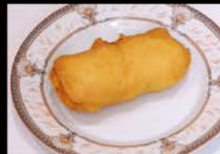
Dolce Nutella 3.50€