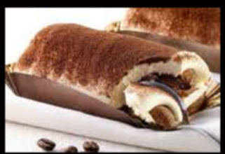
Tiramisu savoiardi 5.00€