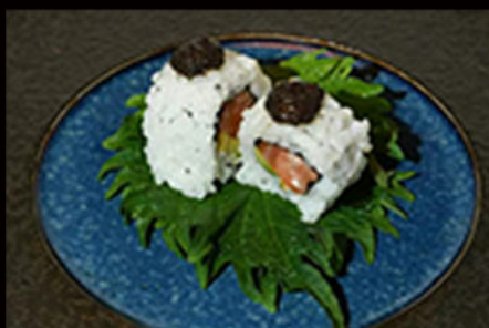
116. Uramaki sake truffle

surimi di granchio, tonno cotto, maionese, misti carpaccio di pesci, philadelphia Allergeni: 2,3,4,7