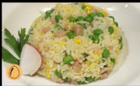
194. Riso Cantonese 4.00€ riso con prosciutto cotto,piselli Allergeni: 3