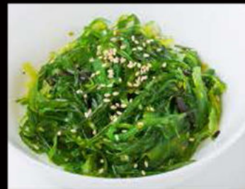
47. Wakame salad 4.00€ goma wakame Allergeni: 11