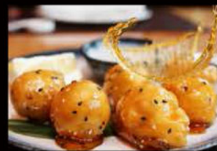
Frutta mista caramellata 4.50€