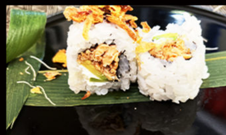
91. Uramaki miura 7.00€ pesce cotto, philadelphia, avocado, cipollacrocicante, sesamo, salsa teriyaki Allergeni: 4,6,7,11