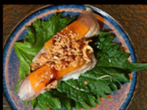
64. Nighiri cheese tonno 4.00€

tonno, formaggio, salsa teriyaki, cipolla croccante, erba cipollina