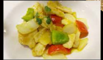
242. Pollo in salsa Curry 5.50€