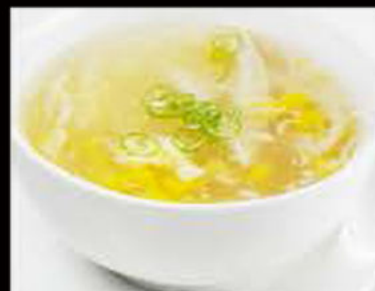
52. Zuppa di Mais e pollo 3.80€ Allergeni: 1,3