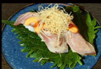
61. Nighiri tonno flambé 4.00€

tonno, salsa flambé, mayo piccante, salsa teriyaki, erba cipollina, pasta kataifi