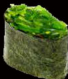
149. Gunkan wakame 2.50€ alga nori,goma wakame,sesamo Allergeni: 11