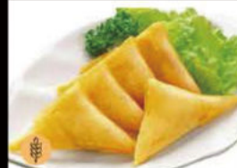
16. Anlgo di Curry 3.50€ Allergeni: 1