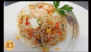
196. Yaki meshi 8.00€ riso con frutti di mare verdure miste,sesamo Allergeni: 2,3,11