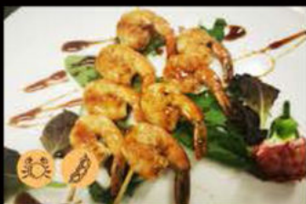
217. Spiedini di gamberi* salsa teriyaki 6.00€