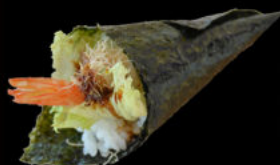
137. Temaki ebiten 4.00€ maionese, salsa teriyaki, gambero fritto, pasta kataifi, tobiko Allergeni: 1,2,3,6