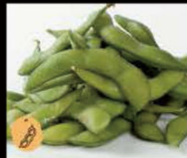
20. Edamame 3.00€ Allergeni: 5,6