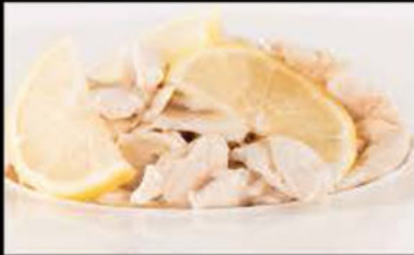
243. Pollo in salsa Limone 5.50€