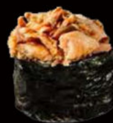
148. Gunkan miura 3.00€ alga nori,pesce cotto, salsa teriyaki,sesamo Allergeni: 4,6,11