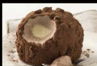
Tartufo classico 5.00€