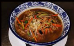
203. Ramen con verdure e uovo in brodo 5.00€ Allergeni: 1,3