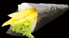
133. Temaki mango 3.50€ philadelphia, mango, sesamo, salsa mango Allergeni: 7,11