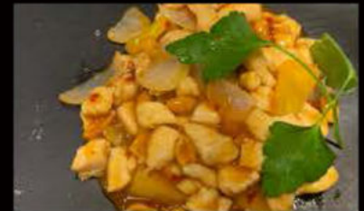
245. Pollo in salsa Piccante 5.50€