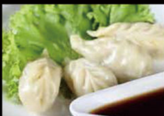
7. Ravioli con Verdure 4.00€ Allergeni: 1,6