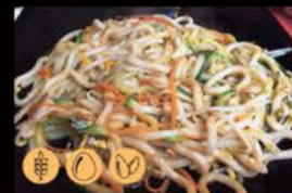
200. Udon con Verdure 6.00€ Allergeni: 1,3,11