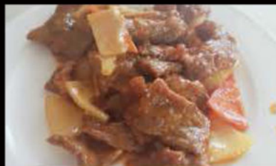
247. Vitello in salsa sacha 6.90€