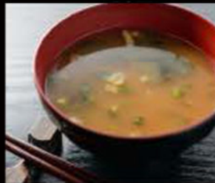
50. Miso shiru 3.00€