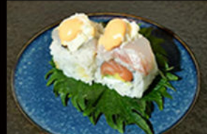
115. Uramaki bufala

gambero fritto, philadelphia, avocado, salmone e mayo piccante on top scottato alla fiamma, pistacchi, salsa teriyaki Allergeni: 2,3,4,6,7,8