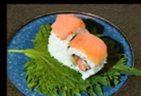
112. Uramaki salmone fumè 12.00€

surimi di granchio, tonno cotto, maionese, misti carpaccio di pesci, philadelphia Allergeni: 2,3,4,7