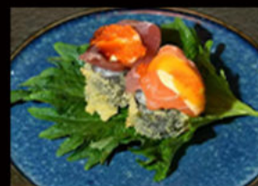
131. hosomaki double 12.00€

avvolto panko fritto in tempura, avocado, philadelphia, salsa teriyaki, pasta kataifi Allergeni: 1,6,7