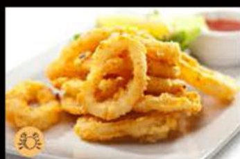
238. Calamari fritti 6.50€