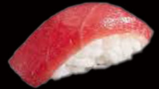
59. Nighiri tonno 3.50€ tonno rosso Allergeni: 4