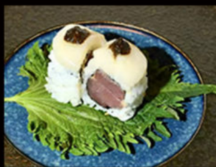
93. Uramaki capesante 14.00€ tonno rosso, mayo piccante, capasanta, crema tartufo Allergeni: 3,4