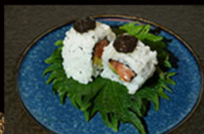
116. Uramaki sake truffle

salmone, avocado, philadelphia, mozzarella di bufala, pesce bianco, mayo piccante Allergeni: 3,4,7