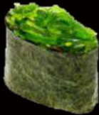
149. Gunkan wakame 2.50€ alga nori,goma wakame,sesamo Allergeni: 11