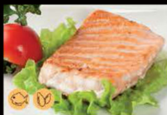
221. Salmone Griglia 8.00€ salsa teriyaki, salmone, sesamo Allergeni: 4,6,11