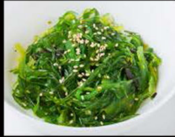
47. Wakame salad 4.00€