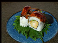
104. Uramaki anguilla 12.00€

avocado, gambero fritto, maionese, salmone on top scottato alla fiamma, salsa teriyaki, granella di tempura Allergeni: 1,2,3,4,6