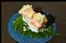
103. Uramaki ebi salmone 9.00€

avocado, gambero fritto, maionese, salmone on top scottato alla fiamma, salsa teriyaki, granella di tempura Allergeni: 1,2,3,4,6