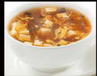
51. Zuppa Agro-Piccante 3.80€