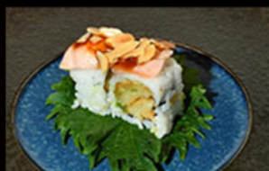
110. Uramaki ebi flambe 12.00€

salmone, avocado, philadelphia, mayo piccante e salmone on top scottato alla fiamma, salsa teriyaki, granella di pistacchio Allergeni: 3,4,6,7,8