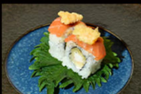
113. Uramaki ebi flower 13.00€

salmone, avocado, philadelphia, salmone affumicato Allergeni: 4,7