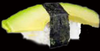
54. Nighiri avocado 2.00€ avocado, philadelphia Allergeni: 7