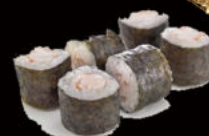
122. Hosomaki ebi 4.50€