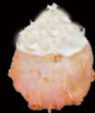
151. Gunkan philadelphia 3.00€ riso,philadelphia,sesamo Allergeni: 7,11