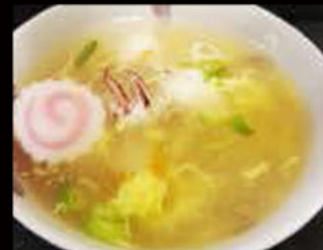
53. Zuppa di Frutti di Mare 5.50€