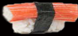
55. Nighiri granchio 2.50€ surimi di granchio Allergeni: 2