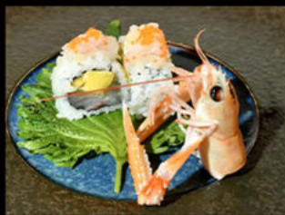
95. Uramaki scampi 14.00€ mayo piccante, pesce bianco, mango, scampi, uova, tobiko, salsa frutto di passione Allergeni: 2,3,4