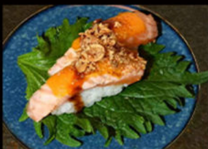
63. Nighiri cheese salmon 3.50€ salmone, formaggio, salsa teriyaki, cipolla croccante, erba cipollina Allergeni: 3,4,6