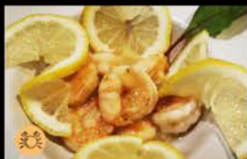
234. Gamberi* con limone 6.50€