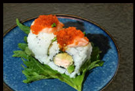
107. Uramaki duke 12.00€

salmone, mango, tartare di salmone, philadelphia, salsa teriyaki, semi di sesamo, mayo piccante Allergeni: 3,4,6,7,11