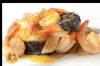
232. Gamberi* in salsa curry 6.50€