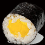
126. Hosomaki mango 4.50€