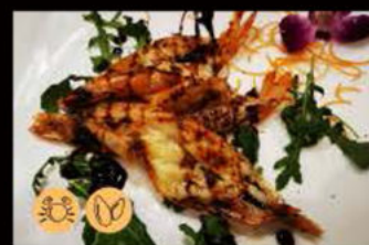
225. Pesce misto Griglia 14.00€ gamberoni, cozze, salmone o tonno, scampi, capasanta, salsa teriyaki Allergeni: 2,4,6,14 max 1 porzione a persona