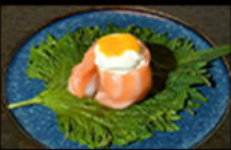
156. Gio philadelphia 4.50€ salmone,philadelphia,semi di sesamo, salsa mango Allergeni: 4,7,11