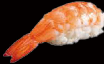
58. Nighiri ebi 3.00€ gambero cotto Allergeni: 2