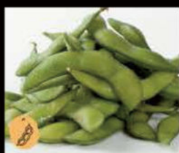
20. Edamame 3.00€ Allergeni: 5,6