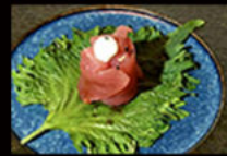
154. Gio maguro 5.50€ tonno,maionese, semi di sesamo Allergeni: 3,4,11