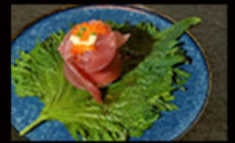
155. Gio spicy tonno 6.00€ tonno,tobiko, mayo piccante,erba cipollina Allergeni: 3,4