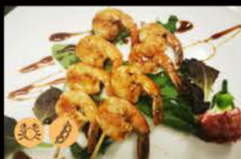
217. Spiedini di gamberi* salsa teriyaki 6.00€ Allergeni: 2,6