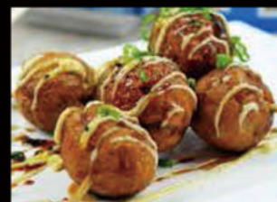
22. Takoyaki 4.00€ polpette di polpo fritto, maionese, salsa teriyaki, katsuobushi, alga in polvere Allergeni: 1,3,14