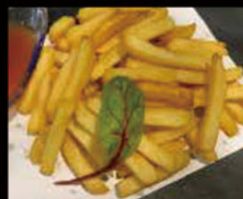
21. Patatine Fritte 2.50€ Allergeni: 1