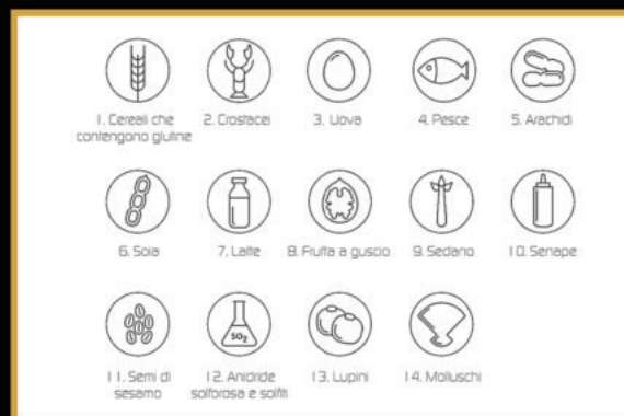
TABELLA ALIMENTI CHE CONTENGONO ALLERGENI

Alcuni ingredienti dei nostri piatti ( contrassegnati con un *) potrebbero essere surgelati all'origine o acquistati freschi surgelati da noi con abbattitore di temperatura per la corretta conservazione nel rispetto della normativa sanitaria.