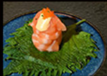
153. Gio spicy salmone 5.50€ salmone,tobiko,mayo piccante, erba cipollina,tobbiko Allergeni: 3,4