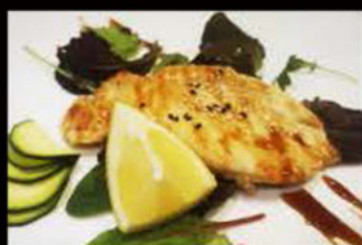
223. Pollo alla Griglia 7.00€ pollo, salsa teriyaki Allergeni: 6,11