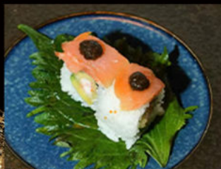
98. Uramaki fumè tartufo 14.00€ gambero fritto, maionese, salmone affumicato, crema di tartufo, avocado Allergeni: 2,3,4