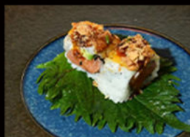
118. Cheese salmone 11.00€

avocado, philadelphia, salmone, crema di tartufo Allergeni: 4,7