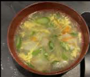
49. Zuppa di asparagi con granchio 4.50€