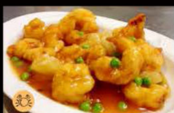
235. Gamberi* in salsa agrodolce 6.50€