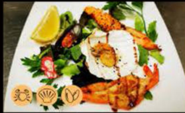
224. Gamberoni* 11.00€ gamberoni, salsa teriyaki Allergeni: 2,6,11 max 4 porzione a persona