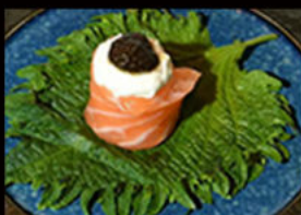
160. Gio tartufo 4.50€ salmone,philadelphia,crema tartufo Allergeni: 4,7