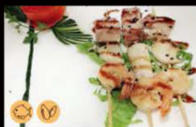
226. Spiedini Frutti di Mare 10.00€ pesce misto Allergeni: 4,11