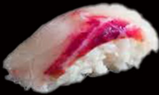
57. Nighiri branzino 3.00€ branzino Allergeni: 4