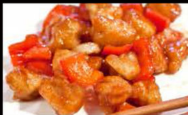
244. Pollo in salsa Agrodolce 5.00€