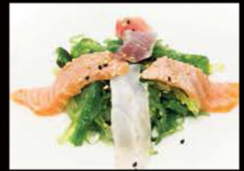
48. Wakame miste 7.00€

goma wakame con misti di pesce crudi, salsa dressing wasabi