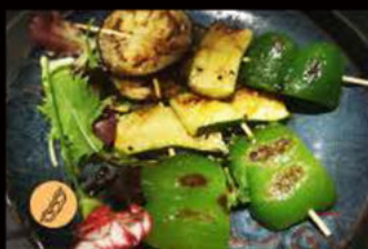
220. Verdure miste alla piastra salsa teriyaki 5.00€ riso con prosciutto cotto, piselli Allergeni: 6