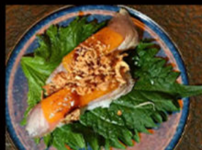
64. Nighiri cheese tonno 4.00€ tonno, formaggio, salsa teriyaki, cipolla croccante, erba cipollina Allergeni: 3,4,6