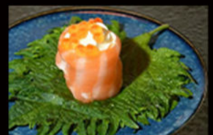
162. Gio ikura 5.00€ salmone,philadelphia,ikura Allergeni: 4,7