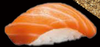
56. Nighiri salmone 3.00€ salmone Allergeni: 4