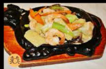
233. Gamberi* con verdure miste 7.00€