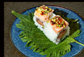
109. Uramaki pistacchio flambé 12.00€

gambero fritto, avocado, tartare di tonno, mayo piccante, tobiko, salsa teriyaki Allergeni: 2,3,4,6