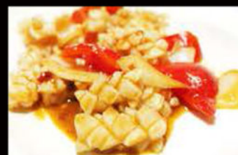
239. Calamari in salsa piccante 6.50€