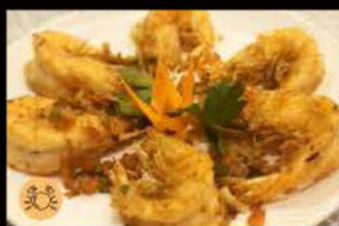
231. Gamberoni* in salsa e pepe 9.50€