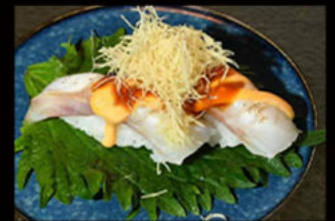
62. Nighiri Suzuki flambé 4.00€ branzino, salsa flambé, mayo piccante, salsa teriyaki, erba cipollina, pasta kataifi Allergeni: 1,3,4,6