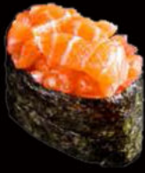
146. Gunkan sake 3.00€ alga,salmone,maionese piccante, erba cipollina,sesamo Allergeni: 3,4,11