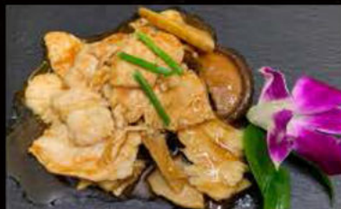
240. Pollo con bambù e funghi 5.50€