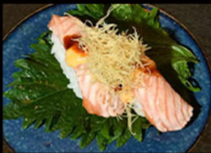
60. Nighiri salmon flambé 3.50€ salmone, salsa flambé, mayo piccante, salsa teriyaki, erba cipollina, pasta kataifi Allergeni: 1,3,4,6