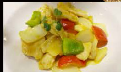
242. Pollo in salsa Curry 5.50€