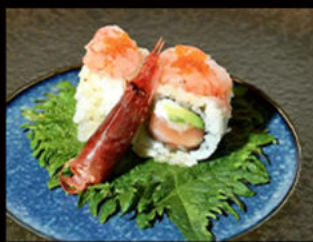
94. Uramaki amaebi 14.00€ salmone, avocado, philadelphia, carpaccio di gambero rosso on top, uova tobiko, salsa dressing wasabi Allergeni: 2,3,4,7,10