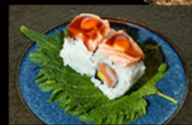
106. Uramaki mango 11.00€

gambero fritto, avocado, maionese, anguilla on top, salsa teriyaki, semi di sesamo Allergeni: 2,3,4,6,11