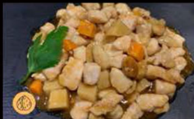
241. Pollo con Mandorle 5.50€ Allergeni: 8