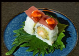
108. Uramaki ebituna 11.00€

salmone fritto, philadelphia, avocado, tartare di salmone, mayo piccante, tobiko, salsa teriyaki, erba cipollina Allergeni: 3,4,6,7