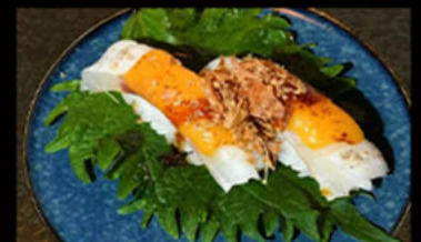
65. Nighiri cheese suzuki 3.50€ pesce bianco, formaggio, teriyaki, cipolla, croccante, erba cipollina Allergeni: 3,4,6