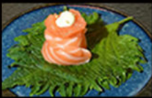
152. Gio salmone 5.00€ salmone,maionese,semi di sesamo Allergeni: 3,4,11

Ogni piatti massimo 2 porzioni a persona