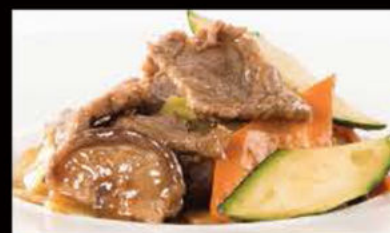
248. Vitello con bambù e funghi 6.90€