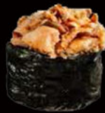
150. Gunkan tonno 3.00€ alga nori,riso,tonno cotto,maionese,sesamo Allergeni: 3,4,11