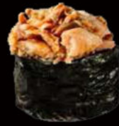
148. Gunkan miura 3.00€ alga nori,pesce cotto, salsa teriyaki,sesamo Allergeni: 4,6,11