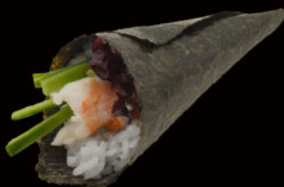
142. Temaki ebi 4.00€ maionese, avocado, maionese, gambero cotto, sesamo Allergeni: 3,4,11