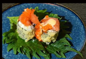
132. hosomaki noodles 8.50€

hosomaki avvolto panko fritto in tempura, tartara salmone e tartare tonno in top, mayo piccante, salsa teriyaki, uova tobiko, crema di tartufo, salsa mango Allergeni: 1,3,4,6