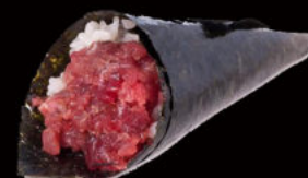
141. Temaki spicy maguro 5.00€ avocado, maionese piccante, cetrioli, erba cipollina, tonno rosso, tobiko Allergeni: 3,4