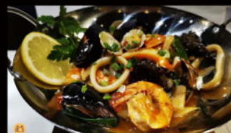
227. Frutti di Mare alla Ganguo 11.00€ frutti di mare con verdure, piccante Allergeni: 2 max 1 porzione a persona