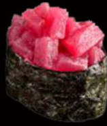
147. Gunkan tuna 3.50€ alga nori,tonno rosso,maionese piccante, erba cipollina,sesamo Allergeni: 3,4,11