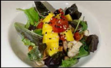
43. Insalata Qi 7.00€

misticanza, mango, avocado, pesce cotto, salsa insalata