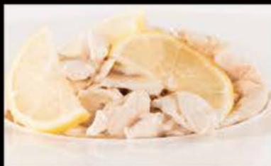
243. Pollo in salsa Limone 5.50€