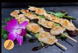
218. Spiedini di pollo salsa teriyaki 6.50€ Allergeni: 6