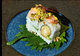
114. Uramaki ebi pistacchio

gamberi fritti, avocado, maionese, tartare di salmone, salsa teriyaki, avocado, fiore di zucca Allergeni: 2,3,4,6