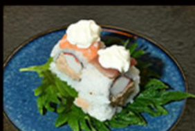
111. Uramaki rainbow 11.00€

gambero fritto, gamberi cotti, mayo piccante, tartare di salmone, salsa teriyaki, scaglie di mandorle Allergeni: 2,3,4,6,8