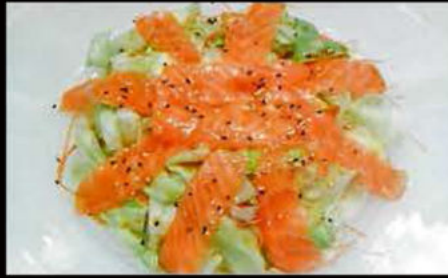
44. Insalata sake 6.50€

misticanza, pomodoro, salmone, sesamo, salsa insalata