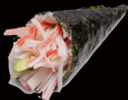
143. Temaki california 4.00€ maionese, avocado, cetrioli, surimi di granchio, sesamo Allergeni: 2,3,11