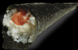
139. Temaki philadelphia 4.00€ salmone, philadelphia, avocado, sesamo Allergeni: 4,7,11