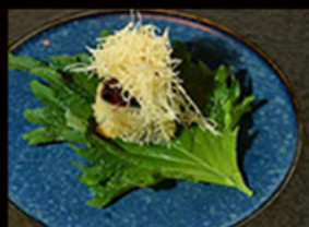
129. Hosomaki sake fritto 5.50€

hosomaki fritto con pesce bianco, avocado, philadelphia, crema di tartufo, salsa teriyaki Allergeni: 4,6,7