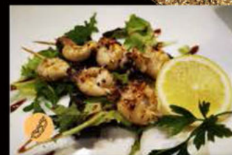
219. Spiedini di seppie salsa teriyaki 6.50€ Allergeni: 2,3