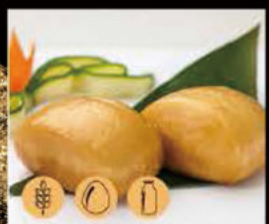
18. Pane Fritto 3.00€ Allergeni: 1,7