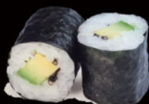
124. Hosomaki avocado 4.00€