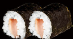
123. Hosomaki Suzuki 5.00€