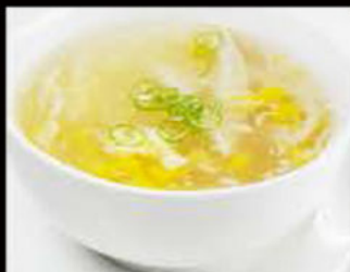
52. Zuppa di Mais e pollo 3.80€