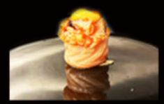
159. Gio flambè 5.50€ salmone scottato alla fiamma, salsa teriyaki,semi di sesamo, mayo piccante,erba cipollina Allergeni: 3,4,6,11