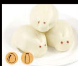
19. Pane crema 2.50€ Allergeni: 1,3,7