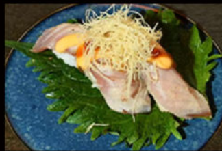
61. Nighiri tonno flambé 4.00€ tonno, salsa flambé, mayo piccante, salsa teriyaki, erba cipollina, pasta kataifi Allergeni: 1,3,4,6