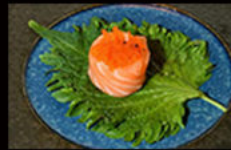
158. Gio tobiko 5.00€ salmone,maionese, tobiko,salsa ponzu Allergeni: 3,4