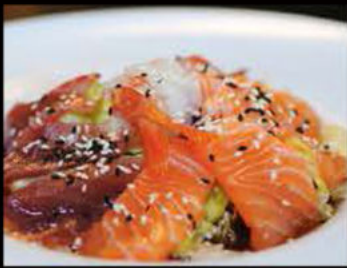
46. Insalata sea salad 7.00€

misticanza con misti di pesce crudi, salsa insalata