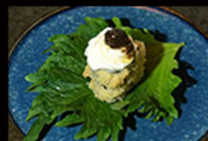
128. hosomaki suzuki fruffle 9.00€

cetriolo, surimi di granchio Allergeni: 2