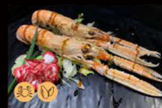
222. Scampi Griglia 11.00€ scampi, salsa teriyaki, sesamo Allergeni: 2,6,11 max 2 porzione a persona