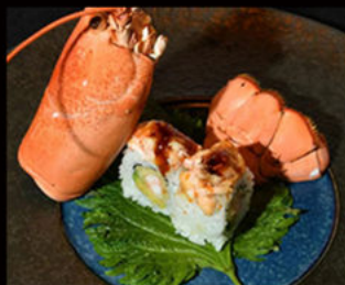
96. Uramaki dragon 16.00€ gambero fritto, mazzancolle, tartar dell'astice, avocado, maionese, salsa teriyaki, tobiko Allergeni: 2,3,6