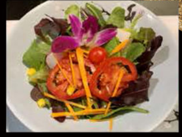
45. Veggy salad 5.00€

misticanza, pomodoro, mais, sesamo, salsa insalata