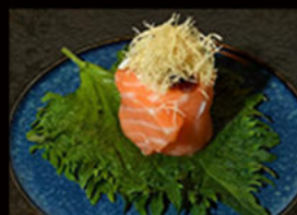
161. Gio kadaifi 4.50€ salmone,philadelphia,salsa teriyaki,pasta kadaifi Allergeni: 1,4,6,7