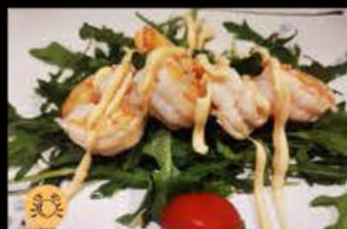
237. Gamberi* con salsa 7.00€