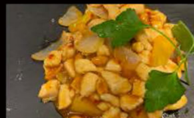
245. Pollo in salsa Piccante 5.50€