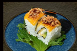
119. Cheese chicken 11.00€

salmone, avocado, philadelphia, formaggio scottato alla fiamma, salsa teriyaki, cipolla frita, erba cipollina Allergeni: 4,6,7