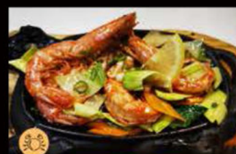
236. Gamberoni* con verdure miste 9.60€