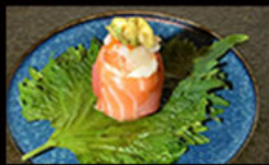
157. Gio sea 6.00€ carpaccio di pesce misto,philadelphia, gambero argentina,cubetti di avocado, salsa dressing wasabi,tobiko Allergeni: 2,4,7,10