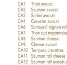
California (8 pièces) CA1 Thon avocat CA2 Saumon avocat CA3 Surimi avocat CA4 Crevette avocat CA6 Samouraï oignon roll CA7 Thon cuit mayonnaise CA8 Saumon cheese CA9 Cheese avocat CA10 Tempura crevettes CA11 Saumon roll cheese CA12 Saumon roll avocat cheese