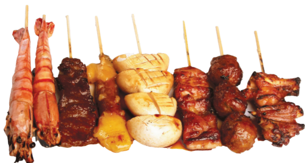
M7 15.90€ 8 brochettes (2 gambas, 1 poulet, 1 boulette de poulet, 1 aile de poulet, 1 bœuf, 1 bœuf au fromage, 1 champignon)