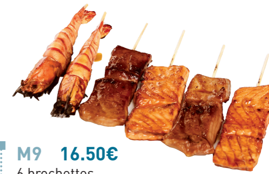
M9 16.50€ 6 brochettes (2 saumons, 2 thons, 2 gambas)