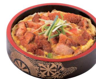
G6 19.50€ Oyakodon + 5 Gyoza