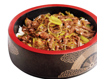
G7 18.50€ Gyunikodon + 5 Gyoza