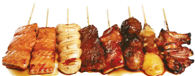
M6 15.90€ 8 brochettes (2 saumons, 1 poulet, 1 boulette de poulet, 1 aile de poulet, 1 bœuf, 1 bœuf au fromage, 1 champignon)