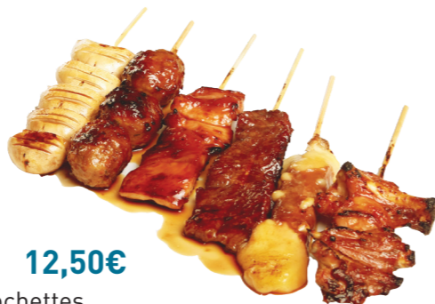
M4 12,50€ 6 brochettes (1 poulet, 1 boulette de poulet, 1 aile de poulet, 1 bœuf, 1 bœuf au fromage, 1 champignon)