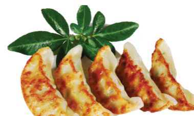
+ 5 Gyoza (Raviolis grillés Poulet et Légumes)