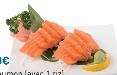
G4 15.90€ 10 sashimi saumon (avec 1 riz) + 5 Gyoza