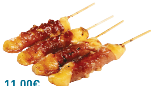
M3 11.00€ 4 brochettes (bœufs au fromage)