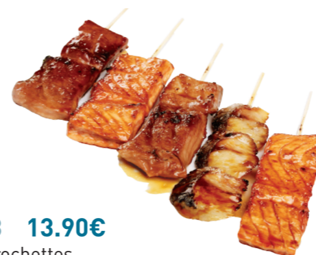
M8 13.90€ 5 brochettes (2 saumons, 2 thons, 1 maquereau)