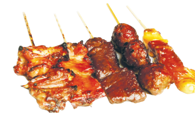
G3 15.50€ 5 brochettes (avec 1 riz) + 5 Gyoza