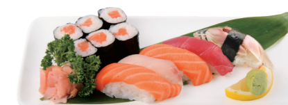
G5 18.50€ 6 Maki et 5 Sushi assortis + 5 Gyoza