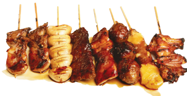
M5 15.90€ 8 brochettes (2 cailles, 1 poulet, 1 boulette de poulet, 1 aile de poulet, 1 bœuf, 1 bœuf au fromage, 1 champignon)