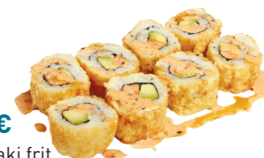
G2 14.90€ 8 California Maki frit, sauce épicé, + 5 Gyoza