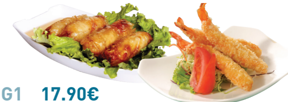
G1 17.90€ 4 nêms au poulet et 4 tempura de crevettes + 5 Gyoza