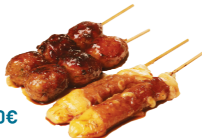
M2 10.50€ 4 brochettes (2 bœufs au fromage, 2 boulettes de poulet)