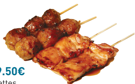
M1 9.50€ 4 brochettes (2 poulets, 2 boulettes de poulet)