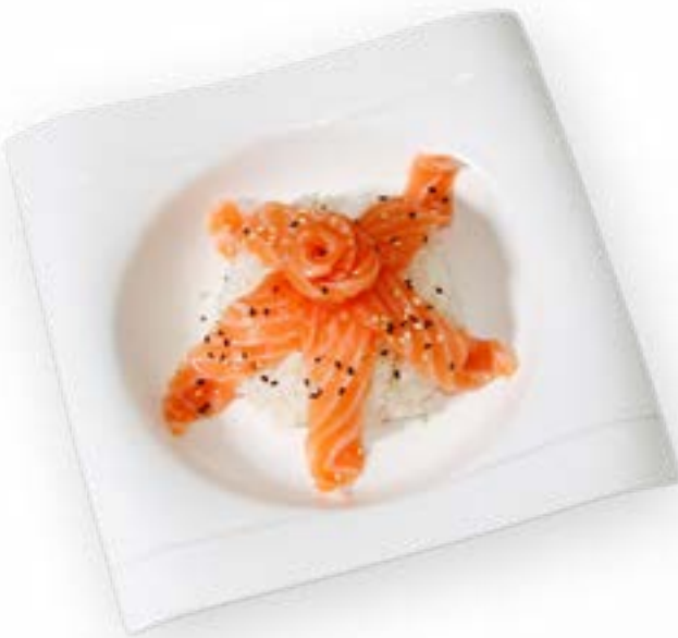
095. SAKE DORI