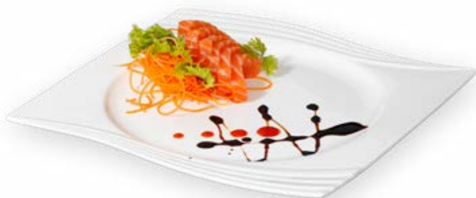
087. SASHIMI SALMONE 6PZ