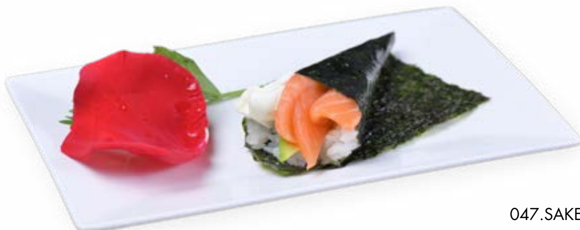
047. SAKE TEMAKI