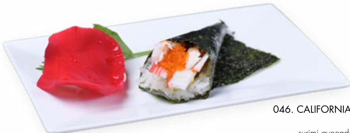
046. CALIFORNIA TEMAKI