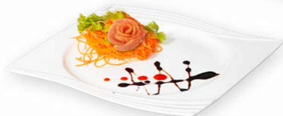
089. SASHIMI SAKE ROSE