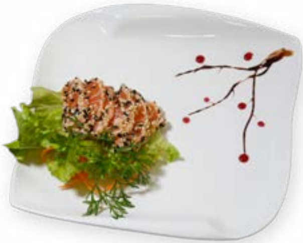
093. TATAKI SALMONE