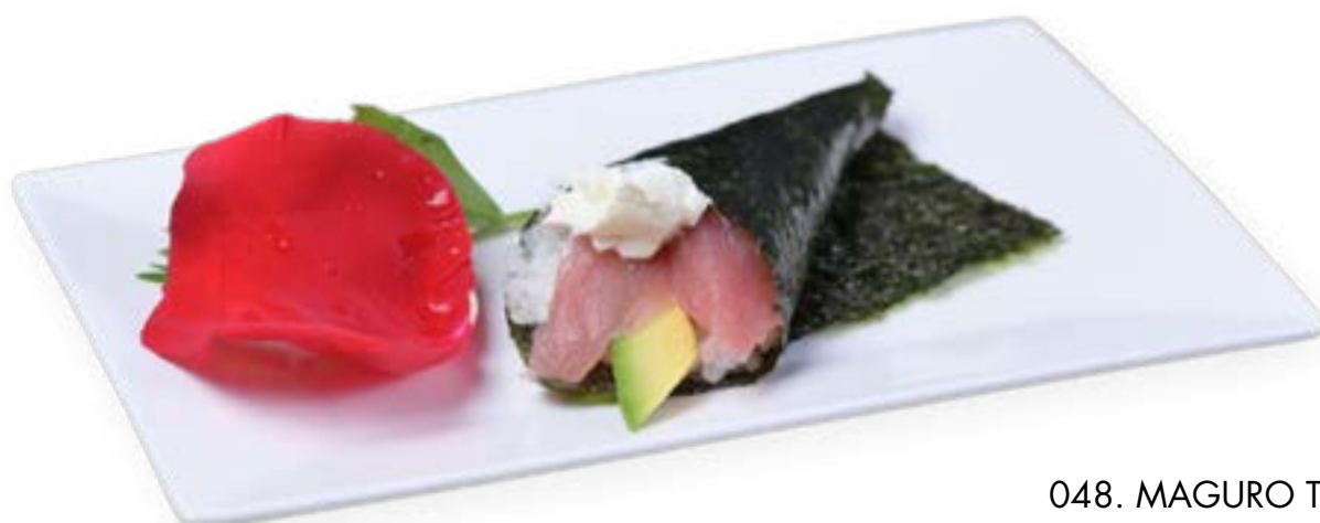
048. MAGURO TEMAKI