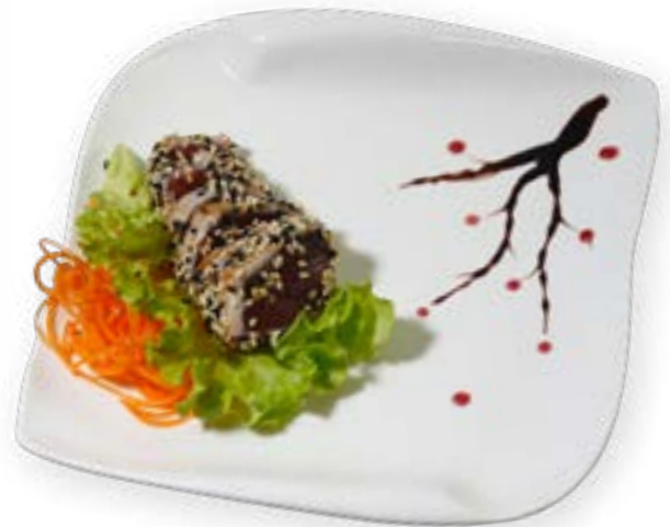
094. TATAKI TONNO